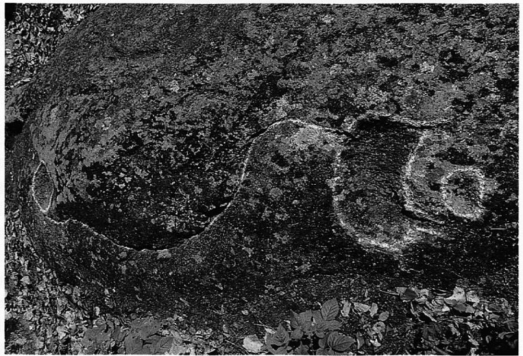
Scaluttas sigl ault oradem la Mutta / Felskopf im Südosten der Mutta