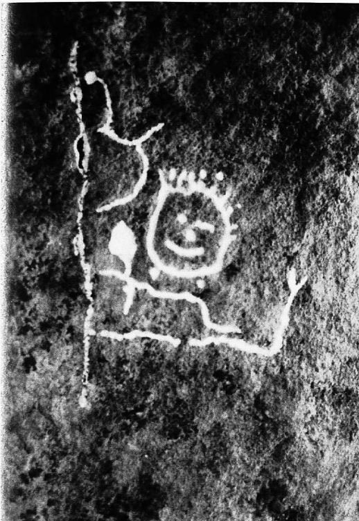
Il legher megaliticher / Der lachende Megalithiker