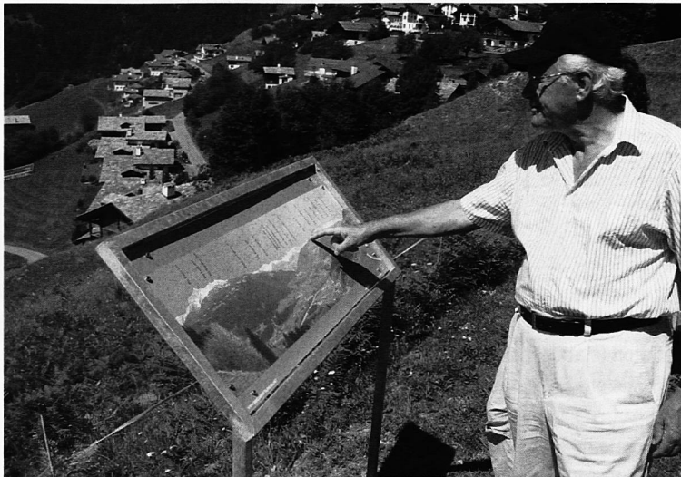
Tabla da panorama/ Panoramatafel

Per guidas romontschas, tudestgas ni talianas saveis vus s'annunziar all'informaziun turistica a Falera, 081 921 30 30. Ina guida da ca. 2 uras cuosta CHF 140.–, per maximal 30 affons. Ulteriuras informaziuns dat ei era sut www.parclamutta.falera.net . Detagls davart la via dils planets survegnis vus sut www.falera.net .