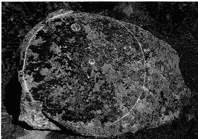
Crap sulegl / Sonnenstein