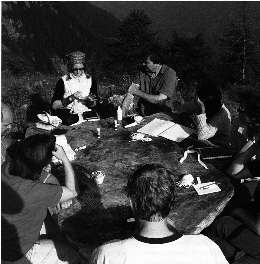
Das Umsetzen der Ziele wird vorbereitet

meisterin und eine unerschöpfliche Kraftquelle. Sie zeigt uns immer wieder auf, dass wir in Wechselwirkung stehen mit der Welt: wir bestimmen und wir werden bestimmt. Wir bestimmen wohl unseren Weg und unsere nächsten Schritte – das Wetter kann jedoch bestimmen, dass wir in der Hütte bleiben oder eine einfachere Route nehmen. Und wenn über uns die erhabenen Bergriesen auf uns niederschauen, spüren wir deutlich, wir sind Teil des Ganzen.