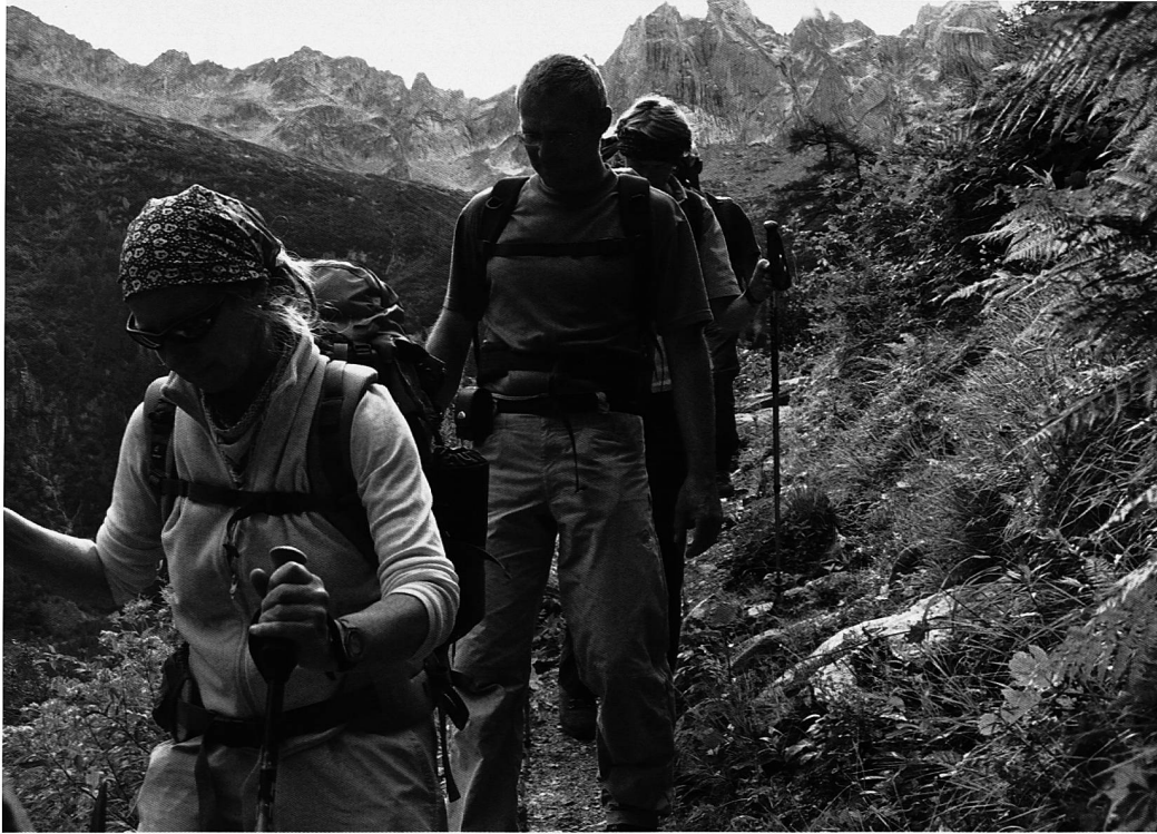
Mal bergauf, mal bergab, wie im Leben auch (Bondasca)

aussendet. Auf diese Weise können auch unbewusste Bedürfnisse entdeckt werden. Vertragen sich diese mit den bewussten, so ist der nächste Schritt fällig: Ich kann mich für ein mir entsprechendes Ziel entscheiden.