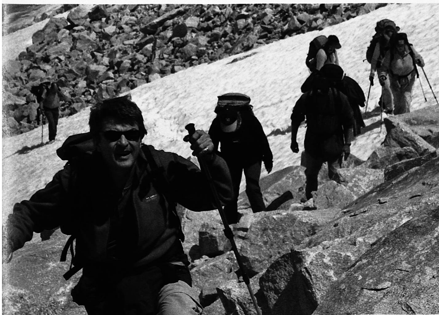
Auch Anstrengung kann lustvoll sein. Bewusstes Körperwahrnehmen im Aufstieg zum Casnilepass

Erst jetzt versuchen Sie herauszufinden, was der Gegenstand mit Ihnen und Ihren Zielen zu tun hat. Vorteilhaft ist es, wenn anschliessend auch Freunde oder Bekannte von Ihnen, ihre Assoziationen zu diesem Gegenstand äussern. Sie haben dabei die Aufgabe, sich jene Stichworte zu merken, bei denen Ihr Körper ein positives Gefühl