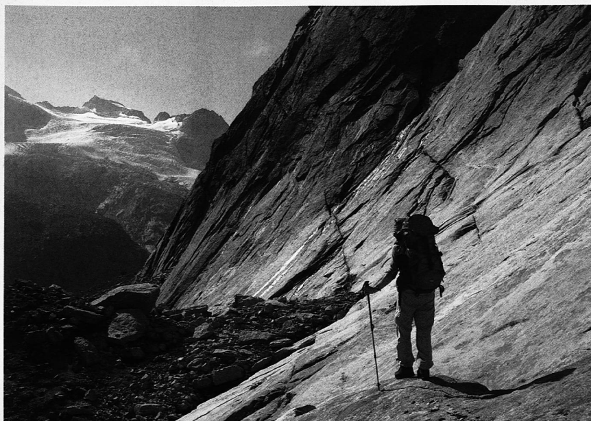
Auch mal mit sich alleine unterwegs (Aufstieg zum Cacciabella-Pass)

Die Natur bietet uns günstige Bedingungen für kreative Lösungen, sie ist uns ein überparteilicher Coach, eine geduldige Lehr-