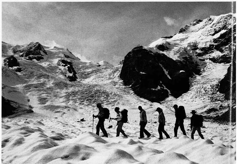
Schweigend bei sich sein (Morteratschgletscher)

Im nächsten Schritt bauen Sie Ihre Ressourcen auf, die zum Erreichen dieses Ziels nötig sind. Auch dies soll auf bewusster und auf unbewusster Ebene geschehen. So wählen Sie zum Beispiel für Ihr Ziel ein entsprechendes Bild: eine Tänzerin, eine Seerose, ein Feuer. Das hängen Sie, allenfalls in diversen Kopien, an strategisch wichti-