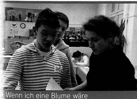
Wenn ich eine Blume wäre

mentar- und Kurzspielfilme, die speziell für den Unterricht ausgewählt und mit didaktischem Begleitmaterial ergänzt wurden und bei «Filme für eine Welt» erhältlich sind – Filme, die Themen aus ganzheitlicher Perspektive aufgreifen und für nachhaltige Entwicklung und eine zukunftsfähige Gesellschaft plädieren.