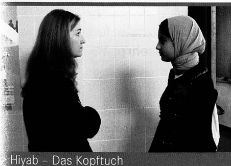
Hiyab – Das Kopftuch