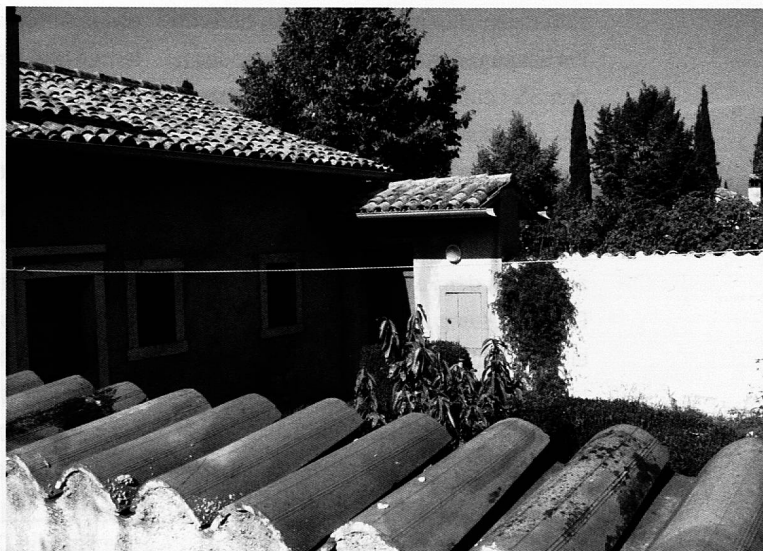
Eremo San Giorgio, Zelle mit Innenhof