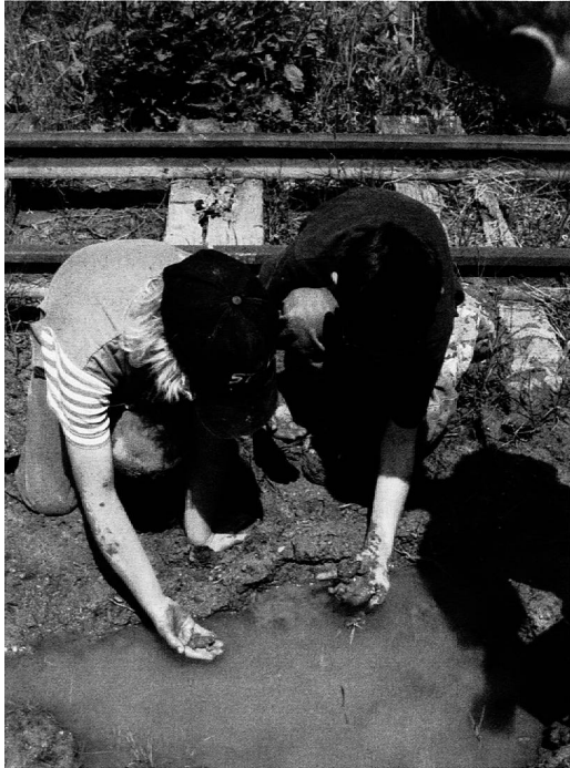
Welche Kröte hüpfert zuerst zurück ins trübe Nass?

Das Projekt «Domoterra for Kids» wurde von den Schweizer Ziegeleien initiiert. Um Kindern einen direkten Umgang mit Lehm zu ermöglichen, kann kostenlos Modellierton bezogen und Gruben besucht werden.