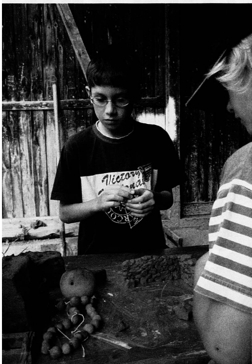
Mit Tonklumpen bauen und gestalten.