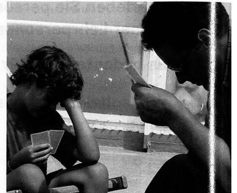
Erziehungsarbeit: Freude oder Last?

■ 2. Unterricht: Die thematischen Schwerpunkte und der Führungsstil haben sich verändert. Der Koordinationsaufwand für alle, v.a. aber für die hauptverantwortliche Klassenlehrperson, ist gestiegen. Gemeinsame Regeln und Absprachen zur Klassenführung (classroom management) haben an Bedeutung gewonnen. Hier