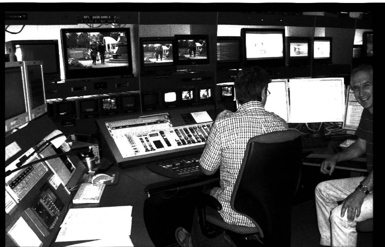
Da hat man gut lachen. Endlich wird die fertige Sendung ausgestrahlt und die Sendeleitung sorgt dafür, dass alles passt.