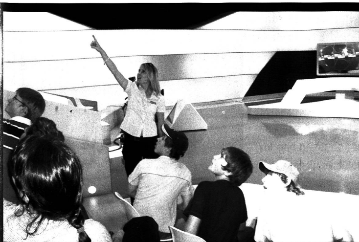
Eine Führung für eine Schulklasse durch das Fernsehstudio. Der Praktikant begleitet eine ehemalige Schülerin aus Thusis, die jetzt beim Fernsehen arbeitet.

Das Schweizer Fernsehen hat gemäss Konzession den Auftrag, bildende Inhalte zu vermitteln. Ich denke, dass dieser beim Schulfernsehen auf unterhaltsame, aber qualitativ hochstehende Art erfüllt wird. «SF Wissen mySchool» sendet pro Jahr rund 220 Stunden Programm, bestehend aus mehreren hundert Beiträgen. Davon können alle Schulen kostenlos profitieren. Ich bin froh, während meines Praktikums einen Beitrag an diesen Service geleistet zu haben.