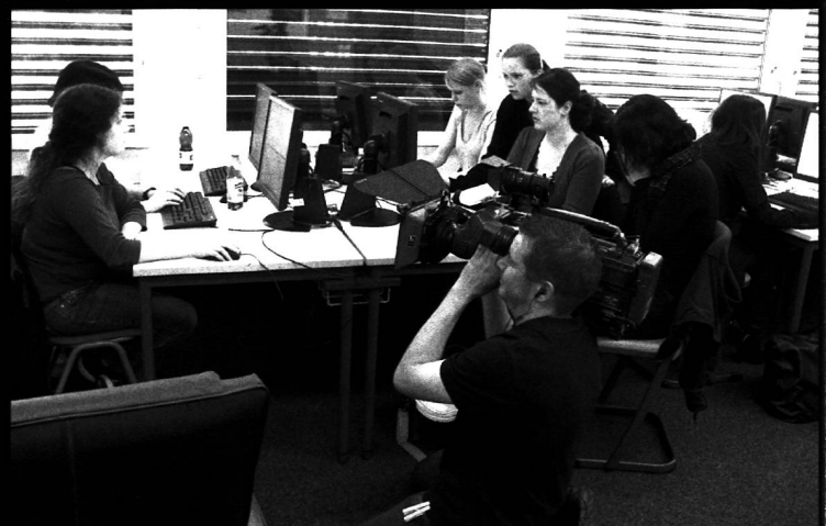
Dreharbeiten in der Berufsschule Winterthur für das Berufsporträt «Buchhändler».