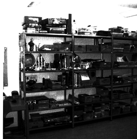
pro vision unterstützt Schulen zum Beispiel beim Erfassen der Bücher für die Bibliothek.

Von einer Zusammenarbeit profitieren beide Seiten: Mit einem Arbeitsauftrag an pro vision erfahren Projektgeber nicht nur Entlastung, sondern geben stellensuchenden Personen gleichzeitig die Möglichkeit,