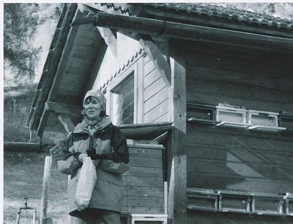
Weshalb gibt es die «schwarze» Biene im UNESCO-Biosphärenreservat Val Müstair?