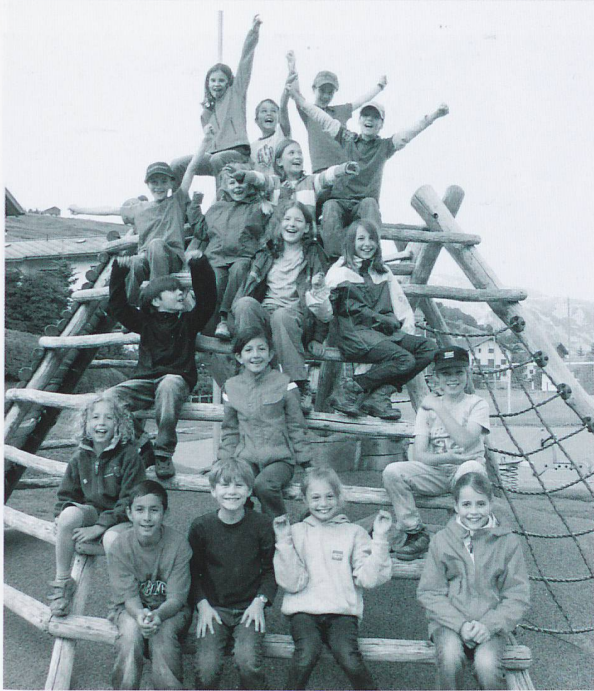
Schulklasse in Falera