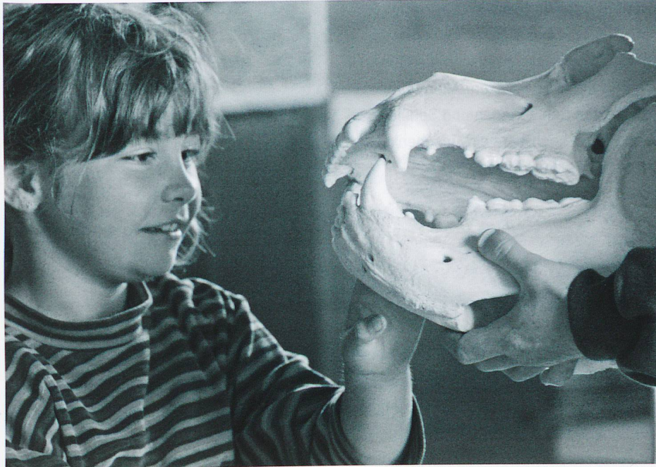
Selbst einem Bären kann man auf den Zahn fühlen.

Die diesjährige Schulkampagne des WWF Graubünden «Die Heimkehrer – Bär, Wolf, Luchs und Bartgeier» läuft noch bis Ende November 2011.