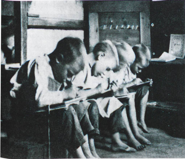
Verfolgt und streng geahndet von den faschistischen Behörden wurden die sog. Katakombenschulen, ein geheimer Unterricht in der Muttersprache, abgehalten im Geheimen, von wenig oder nicht ausgebildeten Personen in Bauernstuben, Kellern und Schuppen.