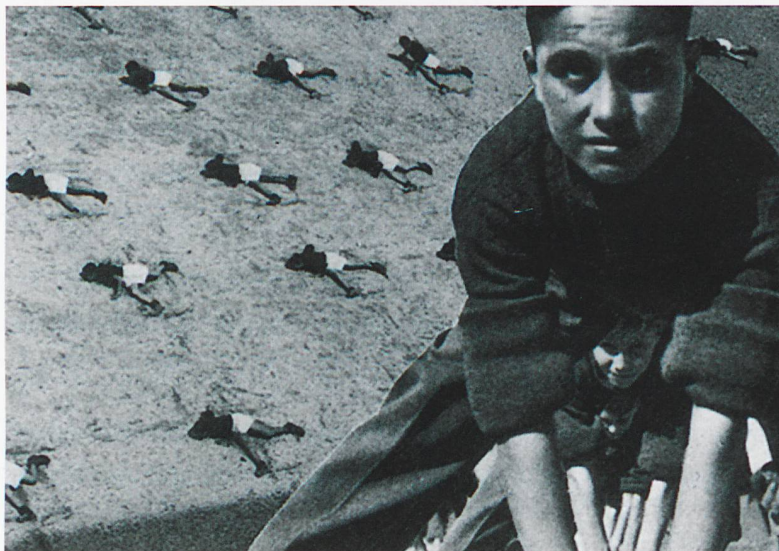
Der Faschismus beabsichtigte die völlige Italianisierung der deutschen Bevölkerung in Südtirol. Ab 1924 wurden die deutschen Lehrer entlassen und die deutsche Sprache in der Schule verboten.

sprachigkeit der Bevölkerung um? Welche Auswirkungen hat die Mehrsprachigkeit auf die Lehrmittel und auf die Ausbildung der Lehrpersonen? Wie wird garantiert, dass die sprachlich unterschiedlichen Schulen ein gleiches Leistungsniveau aufweisen?