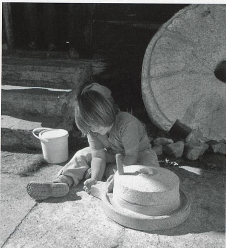
Mit grossem Eifer mahlen die Kinder mit dem Quern das Korn zu Mehl.

Das grosse Interesse der Kinder motiviert, weitere spannende Lernumgebungen im Heimatmuseum zu schaffen.