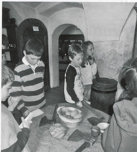
Über alle Sinne erfahren die Kinder die Koch- und Esskultur der Walsen.