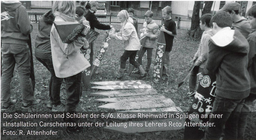
Die Schülerinnen und Schüler der 5./6. Klasse Rheinwald in Splügen an ihrer «Installation Carschenna» unter der Leitung ihres Lehrers Reto Attenhofer.

Ein Treffen mit der informellen Arbeitsgruppe «Kultur & Schule»