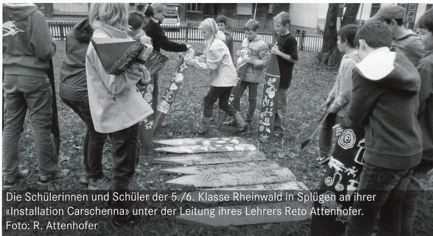
Die Schülerinnen und Schüler der 5./6. Klasse Rheinwald in Splügen an ihrer «Installation Carschenna» unter der Leitung ihres Lehrers Reto Attenhofer.

Ein Treffen mit der informellen Arbeitsgruppe «Kultur & Schule»