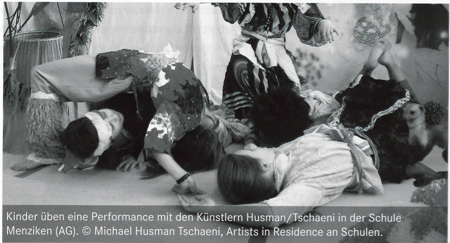
Kinder üben eine Performance mit den Künstlern Husman/Tschaeni in der Schule Menziken (AG). © Michael Husman Tschaeni, Artists in Residence an Schulen.

Die Webseite kulturmachtschule.ch bewirbt das aktuelle Angebot aus den Disziplinen Baukultur, Kulturgeschichte, Literatur & Gesellschaft, Medienkunst & Film, Musik, Theater & Tanz sowie Visuelle Kunst. Die Fachstelle für Kulturvermittlung bietet den Lehrpersonen eine zentrale Anlaufstelle und Beratung in allen Belangen rund um die Kultur in der Schule. «Kultur macht Schule» erreicht jährlich rund 80'000 Schülerinnen und Schüler.