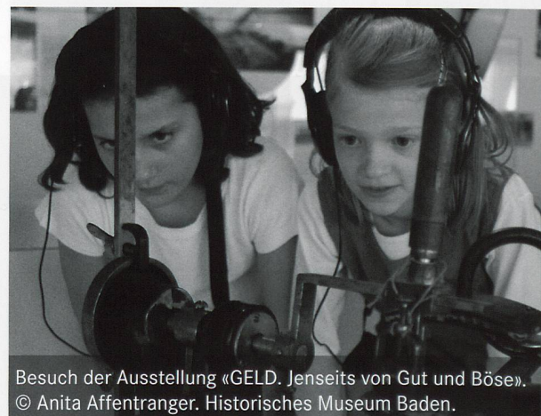
Besuch der Ausstellung «GELD. Jenseits von Gut und Böse». © Anita Affentranger. Historisches Museum Baden.

wie Kunst und Kultur innovativ in den Schulalltag integriert werden können. Für «Artists in Residence an Schulen» verlegen Kulturschaffende ihr Atelier für fünf bis sieben Wochen an eine Schule. Projekte dieser Art bieten die Grundlage, Inhalte zu vertiefen und die Qualität der schulischen Kooperation zu intensivieren. Themen aus den Ateliers werden in den Unterrichtsfächern aufgenommen und geben fächerübergreifende Impulse. Schulen, die kulturelle Projekte in ihr Programm aufnehmen und langfristig planen, erreichen in der Kunstvermittlung eine hohe Qualität und wecken auch im Umfeld der Schule das Interesse.