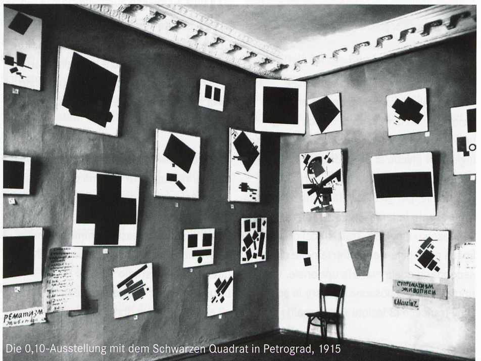
Die 0,10-Ausstellung mit dem Schwarzen Quadrat in Petrograd, 1915

Infos und Anmeldung: www.legr.ch/news/tagungen