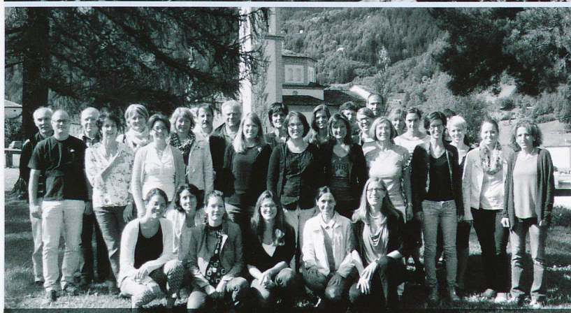
Scuola dell'infanzia, pedagogisti specializzati, scuola elementari, logopedia