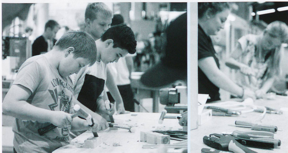
Anmeldung für Schulklassen: www.oba-sg.ch/lehrpersonen

Nebst umfangreichem Informationsmaterial profitieren Besucherinnen und Besucher vor allem vom direkten Gespräch mit den Profis. Mit Auszubildenden oder Berufsexperten aus verschiedensten Fachrichtungen Fragen, Erfahrungen und Wissen auszutauschen – das gibt's nur an der OBA. Für Unentschlossene lohnt sich ein Besuch besonders: Viele Berufe lassen sich gleich ausprobieren und erleben. Die OBA bietet viele weitere (kostenlose) Highlights: Karriereberatung, Berufswahlanalyse, professionelle Bewerbungsfotos, Probe-Bewerbungsgespräche und vieles mehr. Alle Infos unter www.oba-sg.ch .