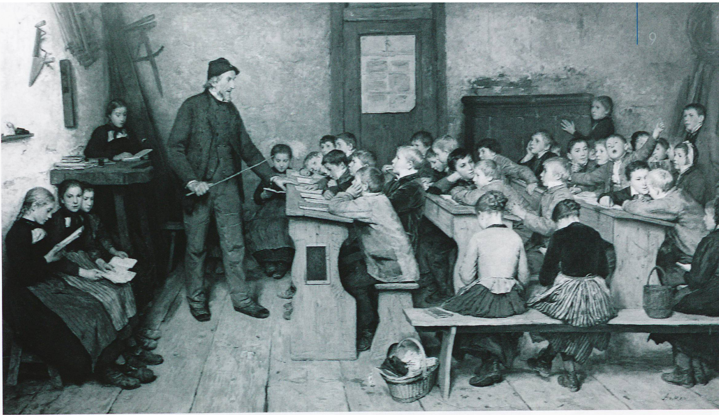
Albert Samuel Anker: Die Dorfschule von 1848

Hattie conferma cha scolars e scolaras rajiundschan meglders resultats schi regna sün tuot ils nivels da la scoula üna buna basa da fiduzcha.