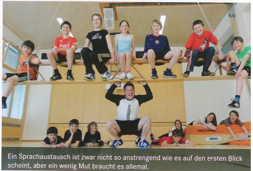
Ein Sprachaustausch ist zwar nicht so anstrengend wie es auf den ersten Blick scheint, aber ein wenig Mut braucht es allemal.

Eine grosse Herausforderung für die Schülerinnen und Schüler – und fast noch mehr für deren Eltern – war die Unterbringung bei einer fremden und zudem auch noch fremdsprachigen Familie, bei der sie dann auch alleine übernachteten. Gleichzeitig war dies aber eine sehr wertvolle Erfahrung für sie. Wenn sie sich dann am nächsten Tag wieder trafen, waren sie sichtlich stolz darauf, diese Herausforderung gemeistert zu haben.