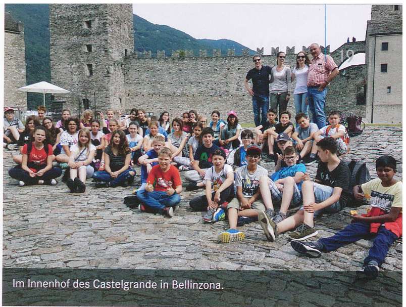
Im Innenhof des Castelgrande in Bellinzona.