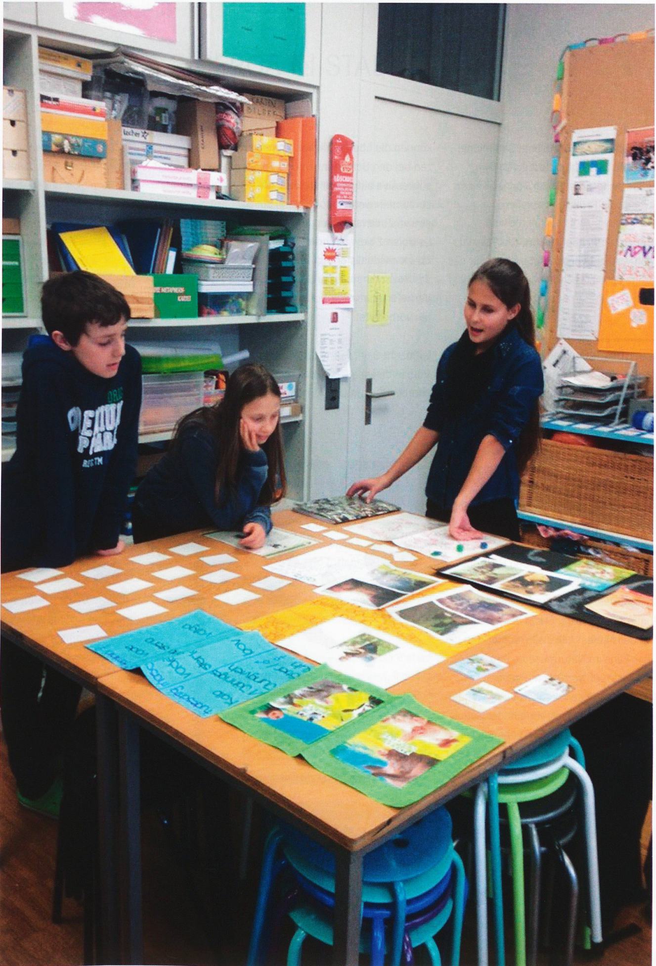
Präsentation der individuellen Arbeiten