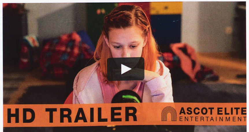
Still aus Trailer «Gefangen im Netz»

Die tschechische Dokumentation ist ein filmisches Experiment: Drei volljährige aber mädchenhaft aussehende Schauspielerinnen geben sich im Netz mit fiktiven Profilen als Zwölfjährige aus und chatten aus sorgfältig nachgebauten Kinderzimmern in einem Filmstudio mit Männern aller Altersgruppen. Die Mädchen werden von 2'458 Männern online aufgespürt und kontaktiert. Der Film erzählt in fesselnden Bildern das Drama der drei Schauspielerinnen vom ersten Casting bis zu den ersten Treffen mit den Männern, die sie kontak-