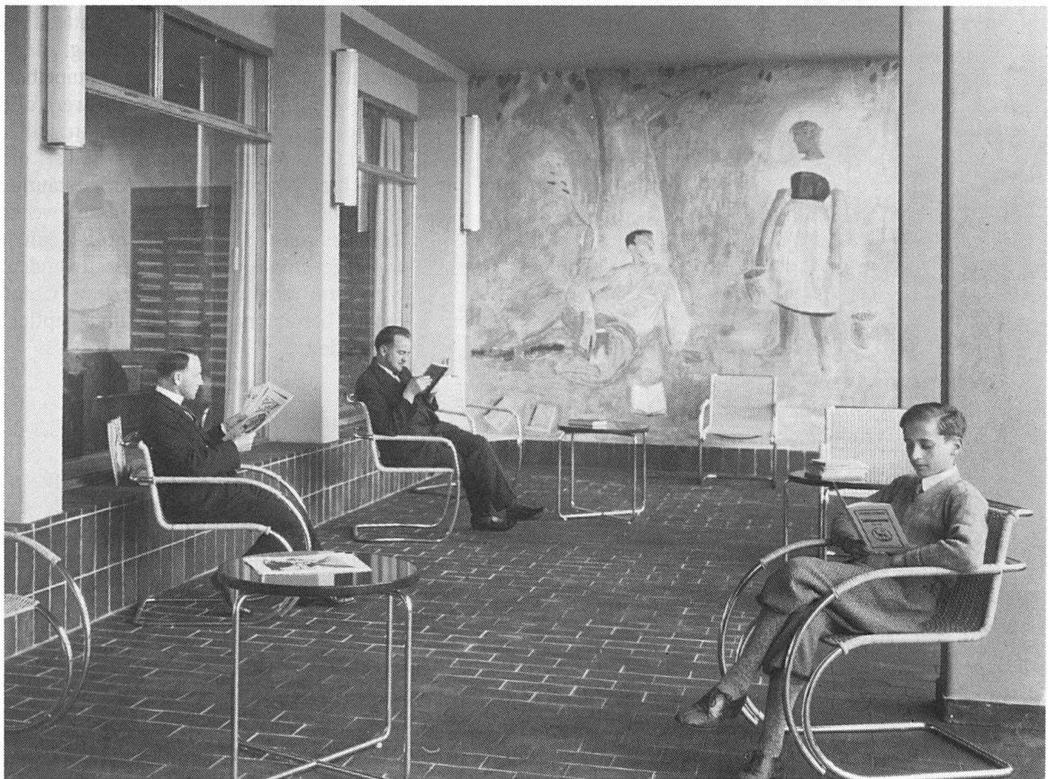
Lesesaal mit Möbeln in Stahlrohrkonstruktion. Sommer 1932.

Diese nicht in Holz gefertigten hinterbeinlosen Stahlrohrstühle entsprachen jenen Gestaltungsprinzipien, welche kreative Einzelleistungen zu einem Ganzen vereinen, die Verbindung von Skulptur, Malerei, Kunsthandwerk, maschineller Produktion im Gesamtkunstwerk der neuen Architektur herstellen wollten. Bereits 1923 konnte in einer umfassenden Ausstellung im Bauhaus Weimar die neue Bau-Idee erfolgreich propagiert werden. In jenem Jahr übernahm László Moholy-Nagy die Leitung der dortigen Metallwerkstätte. Er ermutigte zum Industriedesign, zur maschinellen Herstellung in grossen Stückzahlen, um weite Bevölkerungsteile mit funktionellen und ästhetisch ansprechenden Produkten zu versorgen. 1925 wurde der in Ungarn geborene Marcel Breuer Meister am Bauhaus. Durch seine Möbelentwürfe prägte er die Entwicklung des modernen Designs entscheidend: 1925 schuf er den "Clubstuhl B3", später "Wassily-Stuhl" genannt, mit einem Gestell aus verchromtem Stahlrohr, einer Bespannung aus Leder, Segeltuch oder Eisengarnewebe. Die Einfachheit dieses Modells, seine strikte Linienführung und sein Ausgreifen in den Raum erinnern an die zeitgenössischen Skulpturen der Konstruktivisten. Eine noch stärkere Abstraktion gelang Breuer mit seinem Freischwinger "Cesca", einer Variante der erstmals 1926 vom niederländischen Designer Mart Stam mit seinem "S 33" ins Spiel gebrachten Form.