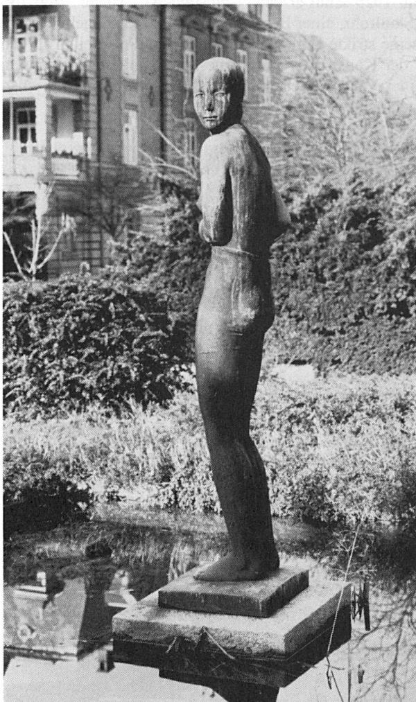
Hans von Matt: Susanna. Bronze. 1931.

Wer die alten Photographien von Bibliothekssaal und -terrasse mit den ursprünglichen Möbeln betrachtet, wird im selben Mass zur Beschäftigung mit Büchern angeregt wie beim Anschauen der Bilder des Arbeitszimmers im Haus Tugendhat in Brünn: mit Glasfront als Trennung zwischen innen und aussen, mit Arbeitsflächen auf Stahlrohrfüssen und Stühlen aus Federstahl und mit Geflechtbespannung. In der Tschechoslowakei, in Deutschland, in der Schweiz schätzte man die nach neuen Gesichtspunkten gestalteten Produkte im Sinne des grossen Designers Mies van der Rohe: "Der lange Weg vom Material über die Zwecke zu den Gestaltungen hat nur das eine Ziel: Ordnung zu schaffen in dem heillosen Durcheinander unserer Tage. Wir wollen aber eine Ordnung, die jedem Ding seinen Platz gibt. Und wir wollen jedem Ding das geben, was ihm zukommt, seinem Wesen nach."