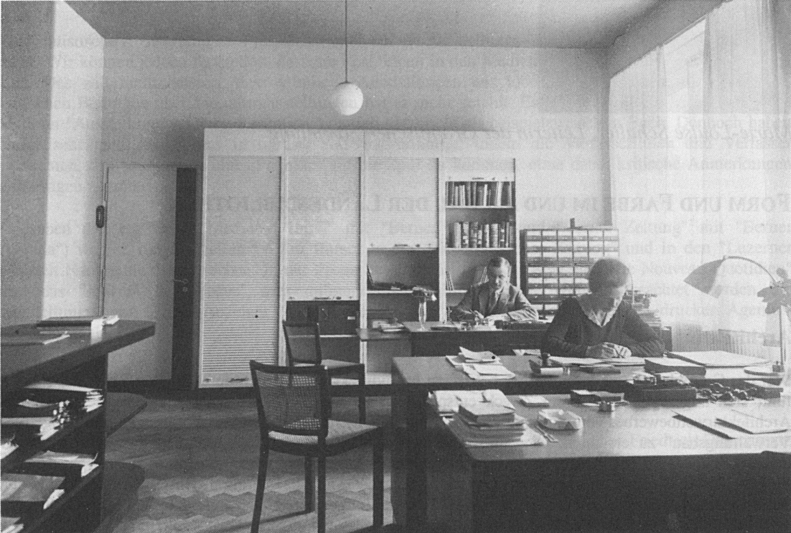
Sekretariat des Bibliotheksleiters, ausgestattet mit dem Einheitsmobiliar. 1931.

Diese einfachen zweckdienlichen Möbel entsprachen den Richtlinien des funktionellen Bauens, die in der Schweiz zu Beginn der dreissiger Jahre lebhaft diskutiert wurden. Der Schweizer Werkbund stellte die Idee einer neuen Wohn- und Lebensform einem breiten Kreis von Interessierten vor, indem er nach dem Beispiel des Deutschen Werkbundes eine Wohnausstellung in den neu errichteten Häusern der Siedlung Neubühl in Zürich-Wollishofen organisierte. Die Möblierung in den gezeigten Wohnungen demonstrierte eine radikale Abkehr von der traditionellen Einrichtung, die mehr Statussymbol denn Wohnhilfe war. Es galt, wie Marcel Breuer vor Zürcher Publikum feststellte, "die Wohnung in den Dimensionen (zu) halten und (auszustatten), dass sie Mann und Frau nicht belastet, dass sie ohne Haushaltführung bewohnt werden kann, dass sie aber auch allen Bedürfnissen des täglichen Lebens (...) genügt. Grundsätzlich" komme man dabei "mit wenigen, einfachen Gegenständen aus, wenn diese in sich gut, vielseitig verwendbar und variationsfähig" seien.