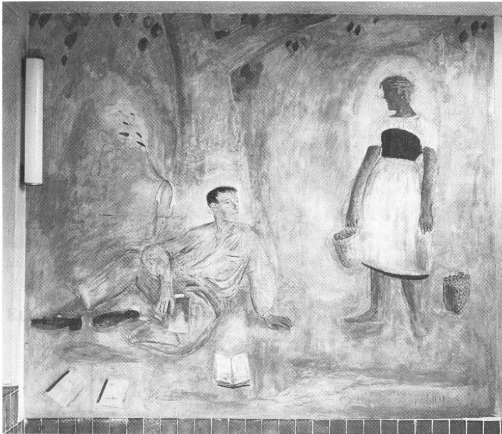
Ernst Morgenthaler: Das junge Paar. Wandbild. 1931.