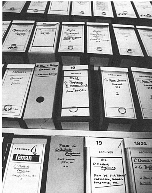
Der Fond Jacques Chessex: Stunde 0.

1953 bis 1956 in Zeitschriften und Zeitungen publiziert, dann aber nirgendwo anders aufgenommen worden sind.