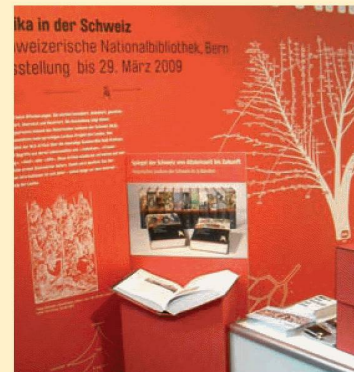
Die NB an der Buch.08