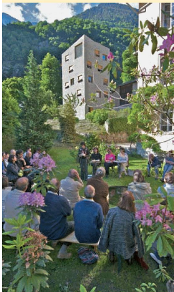
Vernissage Quarto Bergell

Die Lyrik Andri Peers gilt als modern, schwierig, nicht selten sogar als unverständlich. Das Kolloquium in Lavin sollte zeigen, dass auch sie von Traditionen lebt und vielfältige Lesemöglichkeiten eröffnet. Die Veranstaltung war eine Koproduktion von La Vouta, des Schweizerischen Nationalfonds, der Universität Zürich und des SLA.