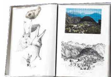
Skizzenbuch von Hans Witschi

WITSCHI, Hans, Skizzenbuch 1985–1987 , 1 Heft, 1985–1987.