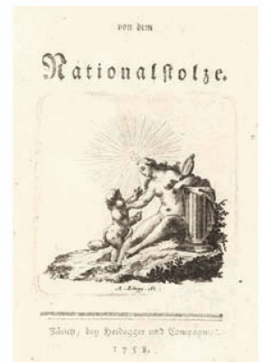
Johann Georg Zimmermann