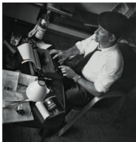
Der junge Schriftsteller Giovanni Orelli an seinem damaligen Schreibtisch. ©

Das Schweizerische Literaturarchiv (SLA) legt die Schwerpunkte für die kommenden Jahre fest und etabliert sich in der internationalen Forschungszusammenarbeit.