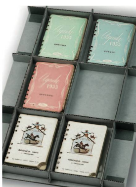
Alice Cerasas kleine Agenden aus den 1950er-Jahren enthalten die ersten Spuren von La figlia prodiga .

Mit Blaise Cendrars erhielt ein weiterer SLA-Autor Klassikerstatus. Seine autobiographischen Werke sind in der Bibliothèque de la Pléiade erschienen; weitere Bände werden folgen. Die literarischen Soireen 34 standen unter dem Motto «Für den Papierkorb geschrieben».