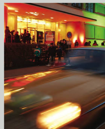
Besondere Stimmung vor der NB mit den Autos des Oldtimer Club Bern, die zwischen den verschiedenen Veranstaltungsorten der Museumsnacht verkehrten

Am zweiten durch das Schweizerische Literaturarchiv (SLA) organisierten Workshop zu diesem Thema trafen sich Forschende und Archivmitarbeitende aus Frankreich und der Schweiz. Analysiert wurden vor allem die Korrespondenznetzwerke von Autorinnen und Autoren, durch die zuweilen literarische Gruppen gebildet und gefestigt wurden. Anhand konkreter Fälle wie Flaubert, Proust, Hesse, Robert Walser oder Georges Borgeaud hat sich der Workshop mit den wichtigsten Aspekten von Korrespondenzen zwischen Schriftstellerinnen und Schriftstellern befasst. Des Weiteren wurden wichtige Fragen der Digitalisierung und deren Auswirkungen auf die Zukunft der Korrespondenz behandelt.