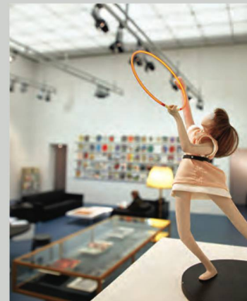
In der Ausstellung wurden auch exklusiv für die Editionen von Parkett geschaffene Werke gezeigt

Die Ausstellung zeigte zum ersten Mal die kompletten 101 Ausgaben der Kunstzeitschrift Parkett . Die Retrospektive zu dieser weltweit renommierten Schweizer Publikation ermöglichte einen Einblick in die Geschichte der Gegenwartskunst von 1984 bis 2017. Neben der Gesamtheit der Ausgaben waren ausgewählte und exklusiv für den Parkett-Verlag geschaffene Kunstwerke von Andy Warhol, Bruce Nauman, Pipilotti Rist und anderen zu sehen. Anhand eines Einblicks in das Verlagsarchiv und von Videointerviews mit Protagonistinnen und Protagonisten erfuhren die Besucherinnen und Besucher Hintergrundinformationen zur Geschichte von Parkett und den Transformationen im Feld der Kunstpublizistik seit den 1980er-Jahren. Die Ausstellung entstand in enger Zusammenarbeit mit dem Parkett-Verlag und wurde durch die Digitalisierung sämtlicher Parkett -Ausgaben begleitet. Diese sind unter www.e-periodica.ch frei zugänglich.