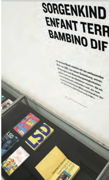
In der Ausstellung LSD. Ein Sorgenkind wird 75 wurde das Buch des Chemikers Albert Hoffmann in verschiedenen Ausgaben und in mehreren Sprachen gezeigt

Ausgehend von Albert Hofmanns Bestseller LSD – Mein Sorgenkind erzählte die Ausstellung von der wechselhaften Geschichte des LSD. 1943 hatte der Schweizer Chemiker Hofmann in seinem Selbstversuch als erster Mensch die halluzinogene Wirkung von LSD erfahren. Wie kaum eine andere Chemikalie beeinflusste sie Literatur, Kunst, Musik und Gesellschaft. So blieb es mehr als eine Ironie der Geschichte, dass die Schweiz das erste Teilverbot von LSD ausgerechnet im vielbeschwo- renen Jahr 1968 aussprach. Die Ausstellung ergründete auch aktuelle illegale und medizinische An- wendungen dieses Stoffs zwischen Sorgen- und Wunderkind. Dabei waren diverse Exponate aus den Sammlungen der Nationalbibliothek und von verschiedenen Leihgebern zum ersten Mal öf- fentlich zu sehen. Die Ausstellung schloss mit einem Besucherrekord.