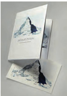
Pugin, Jacques, La montagne s'ombre , 2018