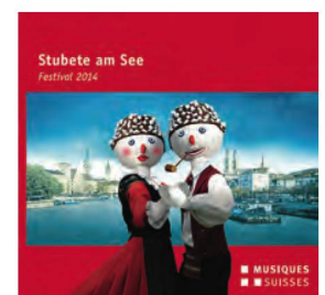
Stubete am See