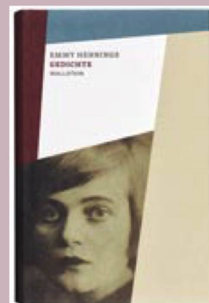
Gedichte von Emmy Hennings