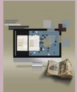
Virtuelle Ausstellung Jean Starobinski. Relations critiques