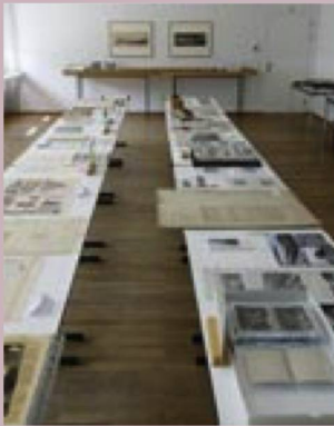
Blick in die Ausstellung anlässlich der Europäischen Tage des Denkmals