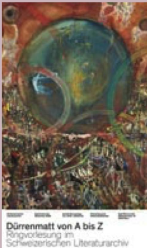
Dürrenmatt von A bis Z: ein Zyklus mit 14 Vorlesungen

Jedes Jahr trifft sich die internationale Digital Preservation Community zur iPRES-Konferenz – die Gelegenheit für Wissenschaftlerinnen und Praktiker, die neuesten Entwicklungen im Bereich digitale Langzeiterhaltung zu präsentieren und zu diskutieren. Da die Konferenz 2020 aufgrund der Pandemie nicht stattfinden konnte, versammelten sich die Fachleute stattdessen online am #WeMissiPRES Festival . Während drei Tagen vernetzten sich Hunderte von Personen weltweit online und tauschten sich zu laufenden Projekten aus. Das Festival schlug eine Brücke zwischen der iPRES-Konferenz 2019 und der auf 2021 verschobenen iPRES-Konferenz und stellte sicher, dass die Diskussionen trotz Pandemie weitergeführt werden können.