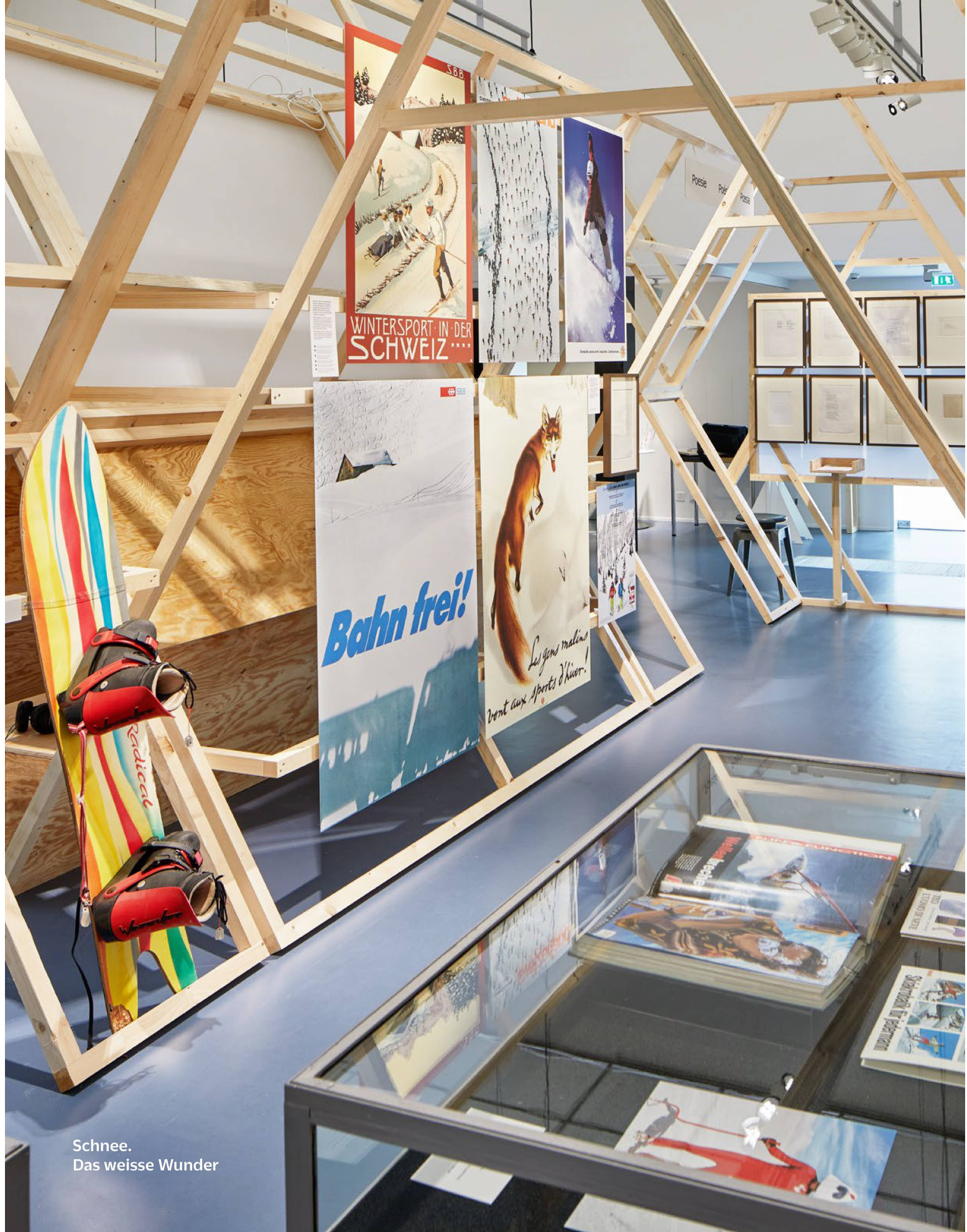
Schnee. Das weisse Wunder