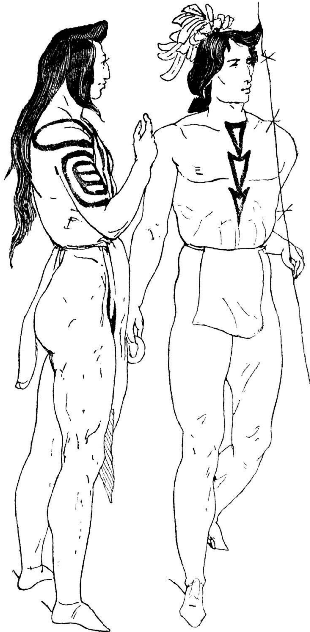
(Fig. 10). Billardspieler. (Skizzenbuch S. 133.)

Ueber die Spiele der Crows und Assiniboins erzählt mir der Boss (Meister, Schütz, Bourgeois) vieles. Die Crows sollen grosse Betrüger sein; die letztern von Natur freigebiger, gutnütiger(?). Sie nehmen ein flaches Becken von Holz, legen darauf einige Bohnen oder Samenkörner, auf einer Seite schwarz gebrannt, nebst Rabenklauen, wovon sich eine durch eine weisse Linie von der Wurzel bis zur Spitze auszeichnet, ferner einige Köpfe von Messingnägeln, wenn sie solche besitzen. Das Becken wird nun mit dem Inhalt aufwärts geschnellt; wie die schwarzen oder hellen Seiten der Körner oben zu liegen kommen, besonders aber, wenn die weisse Spitze der Rabenklau aufsteht, darnach wird gezählt. Das Spiel dauert oft mehrere Tage ununterbrochen fort, nachdem der Verlierende hartnäckig oder seine Mittel bedeutend sind. So lange einer noch etwas zu verlieren hat, schämt er sich aufzugeben. Dabei wird folgende Regel beobachtet, um dem Verlierenden wieder zu seiner Sache zu verhelfen und den Spass zu verlängern: der Gewinner setzt von den gewonnenen Gegenständen das Doppelte an Wert gegen den Einsatz des Verlierenden. Im höchsten Eifer werden oft auch die Lederzelte, die Weiber, ja das eigene Leben eingesetzt — wenn einer alles verspielt hat, keine Wohnung, keine Familie mehr besitzt, darf er sich