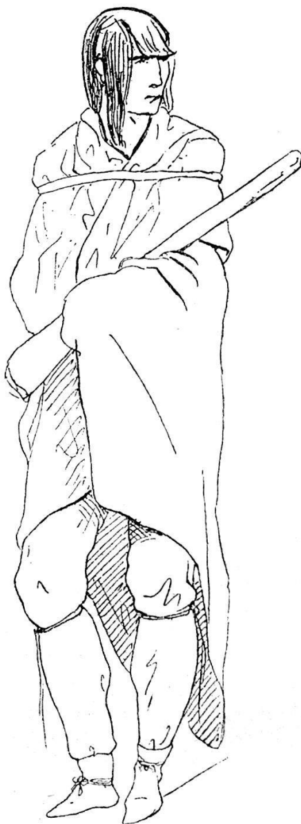
(Fig. 11). Crih.

19. Oktober. Le Tout piqué brachte diesen Morgen eine neue Schar Crihs mit Weibern und Kindern herein. Vor einiger Zeit hatte ich ein flaches Pfeifenrohr weiss und hellblau bemalt, mit Büffel, Wolf, Eule und Bären in den vier weisen Feldern. Dieses Rohr wurde Piqué (« ganz tätowiert ») geschenkt. Es sollte mit grosser Feierlichkeit im Office eingeweiht werden, d. h. mit einer Rede des Tout piqué und dem Anrauchen von allen Kriegern und dem Bourgeois. Herr Dennik hatte die Güte mich einzuladen, der Versammlung beizuwohnen. Dafür durfte Herr Dennik sich als den Maler des Pfeifenrohrs ausgeben; er bat mich, bei der Scene