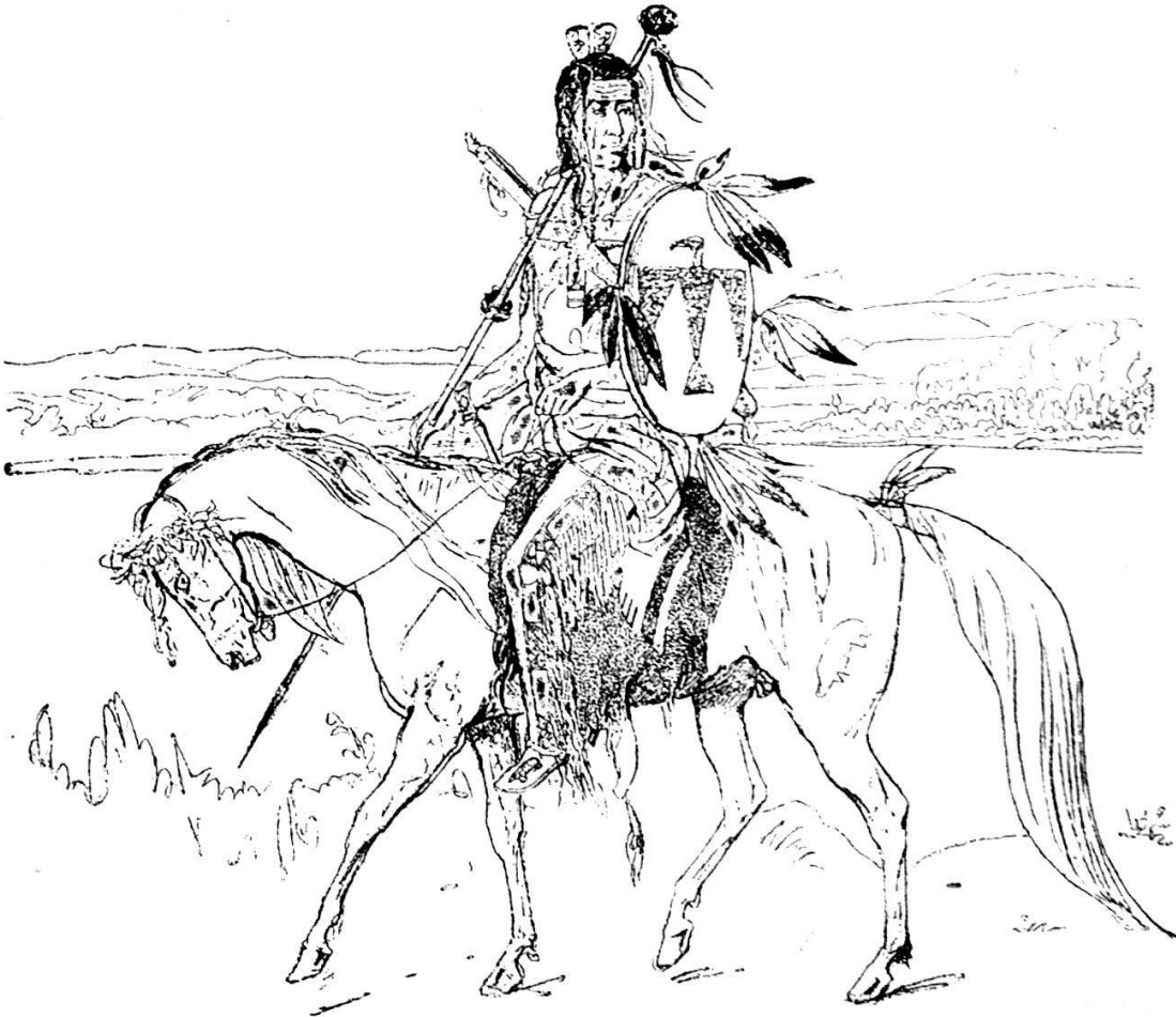
(Fig. 16). Crow-Häuptling. (Skizzenbuch S. 52.)

Keine Nation nennt sich so häufig mit Namen, wie die Crows; mit grossem Selbstgefühl schlagen sie mit der rechten Hand auf ihre Brust und sagen Apsahroka, wobei sie auch die Arme seitwärts aus-