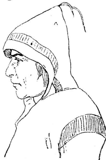
(Fig. 14.) Assiniboin im Winterkostüm. (Skizzenbuch S. 111.)

17. November. Da ich das Wort Sioux französisch ausspreche und es auch bis jetzt von keinem Amerikaner anders habe aussprechen hören, verwunderte ich mich sehr, dass mich Herr Dennik deswegen auslachte und behauptete, man sage Suh , nicht Siuh ; er konnte aber den Ursprung des Wortes aus der Dacotahsprache nicht beweisen, noch einen Grund für seine Aussprache angeben. Nach Charlevoix soll es die Endsilbe des Wortes Nadouessioux sein. Herr Dennik wollte mich auch lächerlich machen, wegen meiner Behauptung, mit Salz könnte man gewisse Tierarten zähmen. Jim Hawthorne 1 war, um sich nach Gewohnheit einzuschmeicheln, gleich bereit, eine Anekdote zu erfinden, dass er einen Jäger gekannt habe, der stets eine Leck-