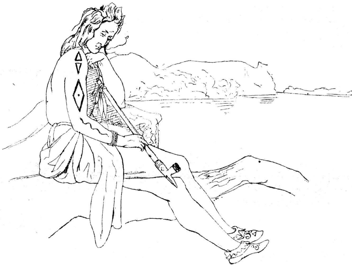
(Fig. 27). Quatre Ours (s. Jahresber. 1894, S. 67). (Skizzenbuch S. 49.)

Auf dem Trockenen angelangt, band ich meine Kostbarkeiten, nämlich Album, Tagebuch und Material in der Tasche in mein liebes Kalbsfell, das mir beständig wegen seiner feinen Haare als Kopfkissen dient; wir legten unsere Ayischimos auf den Prairieboden, Mäntel und Büffelhäute darüber, zogen unsere nassen Kleider aus und schlüpfen