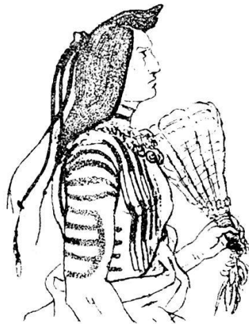
(Fig. 18). Tätowierung: Sioux. (Skizzenbuch S. 36.)