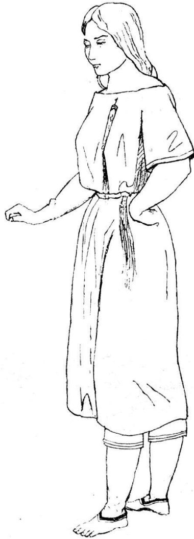
(Fig. 26). Mandanmädchen. (Skizzenbuch S. 120.)