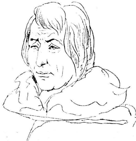
(Fig. 17). Ours fou. (Skizzenbuch S. 168.)