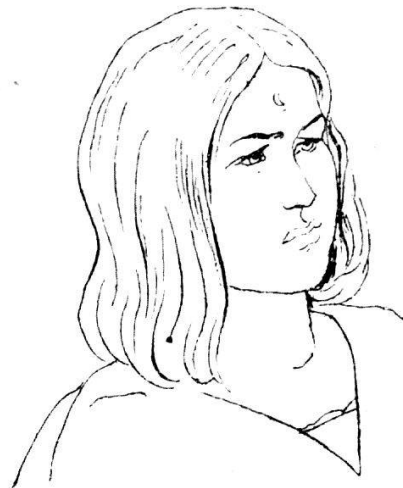
(Fig. 25). „The Queen of Sheba“. (Skizzenbuch S. 178.)