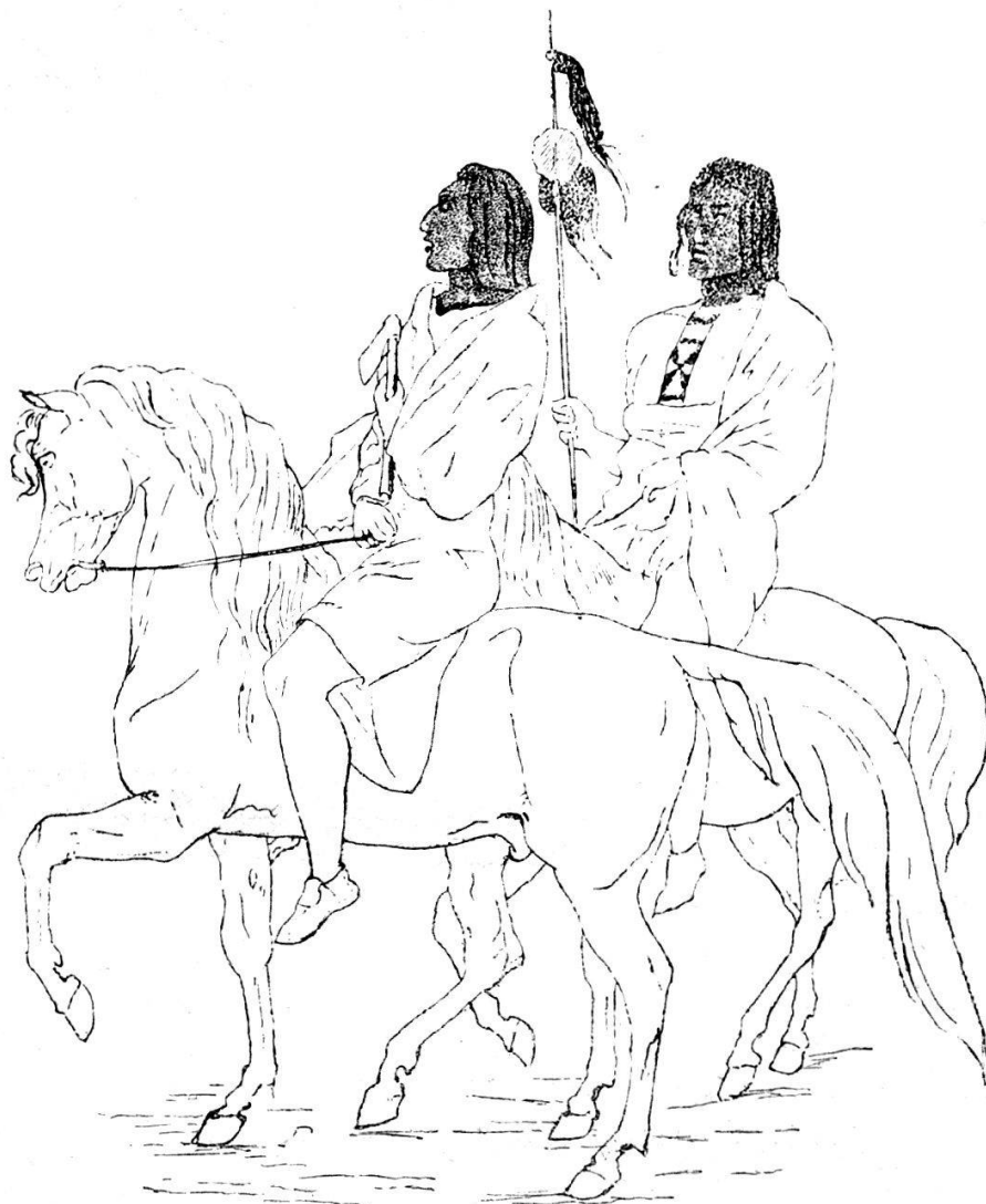
(Fig. 22). Herantsa mit geschwärzten Gesichtern. (Siehe Jahresbericht 1894, S. 62.) (Skizzenbuch S. 80.)

Wie der Junge nach Hause zurückkehrt, sagt ihm die Stiefmutter: das nächste Mal wirst Du auf Deiner Jagd eine Quelle sehen, neben dieser Quelle ein Zelt; gehe nicht hinein, Du könntest ums