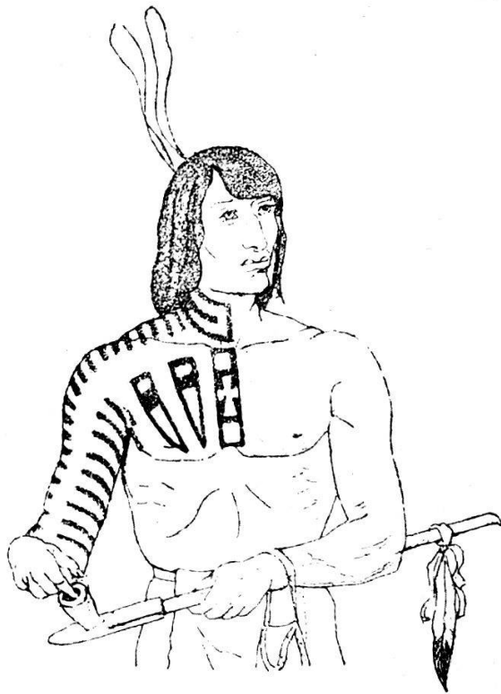
(Fig. 19). Tätowierung: Herantsa. (Skizzenbuch S. 46.)

jagen. Er ist ein leidenschaftlicher Jäger, trifft gut, aber findet nichts; er muss Gehülfen haben, die ihm das Gewild aufspüren, zeigen. — Er kann seine Hütte nirgends aufschlagen, als auf indianischem Gebiete, den guten Willen der Eigentümer seines Jagdgrundes muss er sich erkaufen, oder er wird als Schelm, als Räuber betrachtet, sein Eigentum ihm genommen, er selbst vielleicht, ja wahrscheinlich umgebracht, wenn er sich verteidigt; verjagt, wenn er gutwillig alles im Stiche lässt. Nirgends kann er lange verborgen sein, das scharfe Auge des Indianers wird seine Spur und den Rauch seines Feuers entdecken. Die Kunde seines Jagens auf fremdem Jagdgrunde wird sogleich verbreitet; sein unrechtmässiges Dasein ausgebeutet, benutzt, um von ihm Geschenke, Nahrung u. s. w. zu erbetteln. Sein Haus wird förmlich von Indianern belagert; der Reichste kann solche Bettelei auf die Länge nicht aushalten, denn er kommt ja nicht als Pelzhändler, sondern als Jagdliebhaber. Und wehe ihm, wenn er als Kaufmann auftritt; er zieht sich die Eifersucht der andern Pelzhändler zu, welche in Gesellschaften verbunden grössere Mittel verwenden, welche bereits bekannt sind, ihr Handelsrecht erkaufte haben, ihn verderben können. Herr Palézieux ist aber bloss Jagdliebhaber, seine Squaws verfertigen seine Kleider, er sammelt bloss die Trophäen