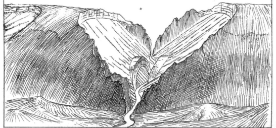
Fig. 1. Querital im Kellenjura. Die harten Schichten bilden zackige, jäh aufstrebende Formen. Diese sind nur durch Verwitterung u. fließendes Wasser entstanden. Motive von Court u. Moutier.