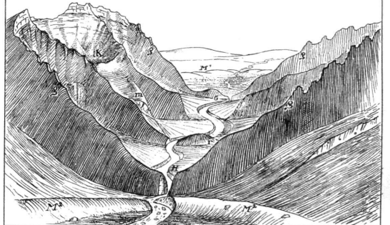
Fig. 2. Querital in den Freiburger Kalkalpen. g. obere Gletschergränze; h. g. gerundete, darüber nachige Felsrippen M 1 u. M 2 - Endmoränen a. Hauptgletschers. m. - Moräne des Karogletschers. K - Karer-Rundbuckel. Motiv Rossière. G. Motiv Greyser. H. Motiv Moriboran. J. Jauntal.