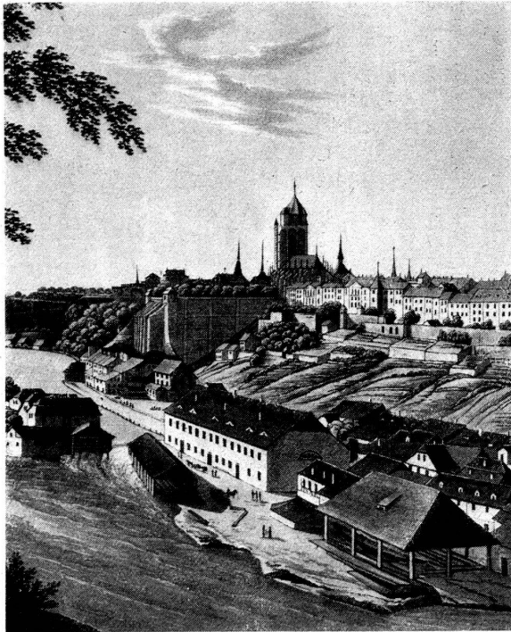
Bild 1. Ansicht von Bern vom Aargauer Stalden aus, um 1850. Über die geschlossene Front der Stadt ragt neben den 40 m hohen Mauern der Münsterterrasse das Münster empor. Im Vordergrund, am Ufer der Aare, Wasserwerke, gewerbliche Anlagen und Wohnhäuser der Matte.