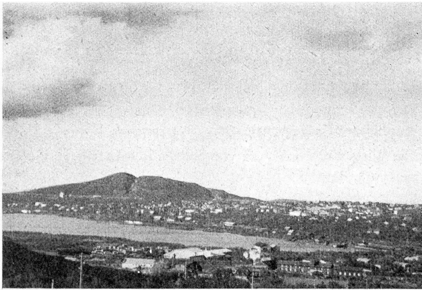
Aufnahme II: Luossavaara mit Kiruna und Luossajärvi vom Kirunavaara aus. Im Vordergrund Verwaltungsgebäude der Bergwerksgesellschaft. 1948.

Der Abbau erfolgt nach modernsten technischen Gesichtspunkten und mit neuzeitlichen Maschinen. Neben rein wirtschaftlichen Überlegungen zwingt auch der Arbeitermangel dazu. Die Ortschaft Kiruna ist 1885 entstanden und dehnt sich in offener Bauweise am Südhang des Haukivaara, nordöstlich des Luossajärvis, aus. Um 1910 zählte die Ortschaft ungefähr 9000 Einwohner, schwankte dann lange