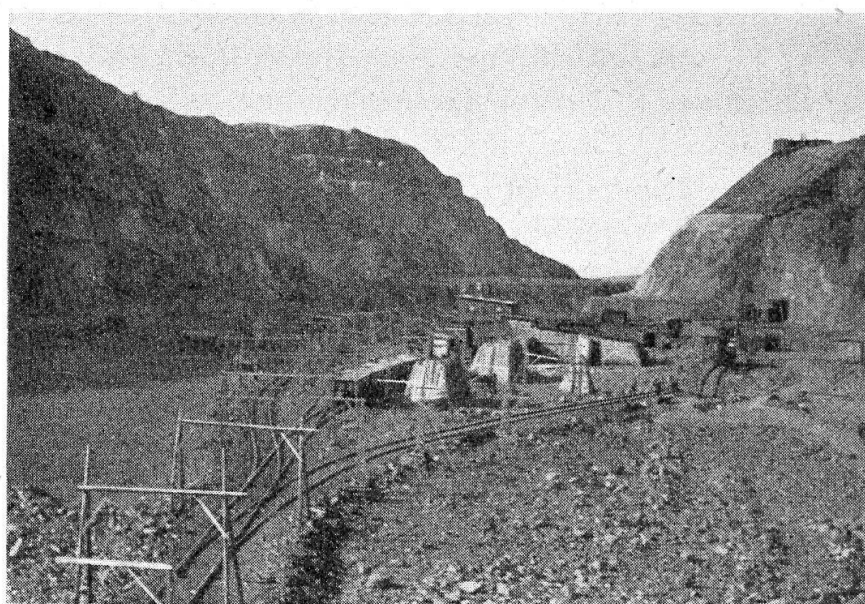
Aufnahme I: Abbaustelle am Kirunavaara mit Geleiseanlagen zur Aufnahme des Erzes und Sprengschutzhütten. 1948.

Die Eisenerzfelder von Kiruna, Besitz der halbstaatlichen Luossavaara-Kirunavaara AB, liefern seit 1936 durchschnittlich zwischen 80–85% der nordschwedischen Gesamtproduktion. Sie haben damit auch in der schwedischen Erzgewinnung eine überragende Stellung gewonnen, da die restliche schwedische Produktion an Eisenerz 1947 noch 2 589 604 t oder 29,1% betragen hat. Die Felder von Kiruna werden voraussichtlich diese Bedeutung noch lange behalten, da die gewaltigen Vorräte sich noch nicht abschätzen lassen. Die letzten Angaben darüber finden sich bei W. Evers in seiner Abhandlung über den nordschwedischen Erzbezirk. Dort werden die Vorräte (1934) am Kirunavaara auf 1000 Millionen t bis