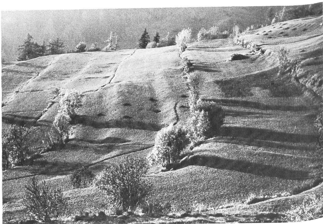
Abb. 29: Scharf profilierte Hochraine verraten im Ober- und Unter-Kastler ehemaliges Ackerland.