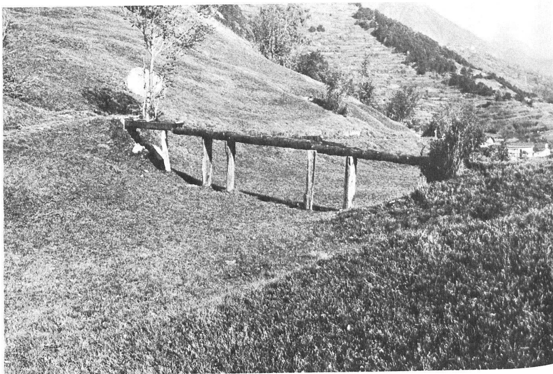
Abb. 28: Bewässertes Wiesland im Westen des Dorfes Erschmatt. Am linken Hang einer der zahlreichen Erratiker des Rhoneeises.