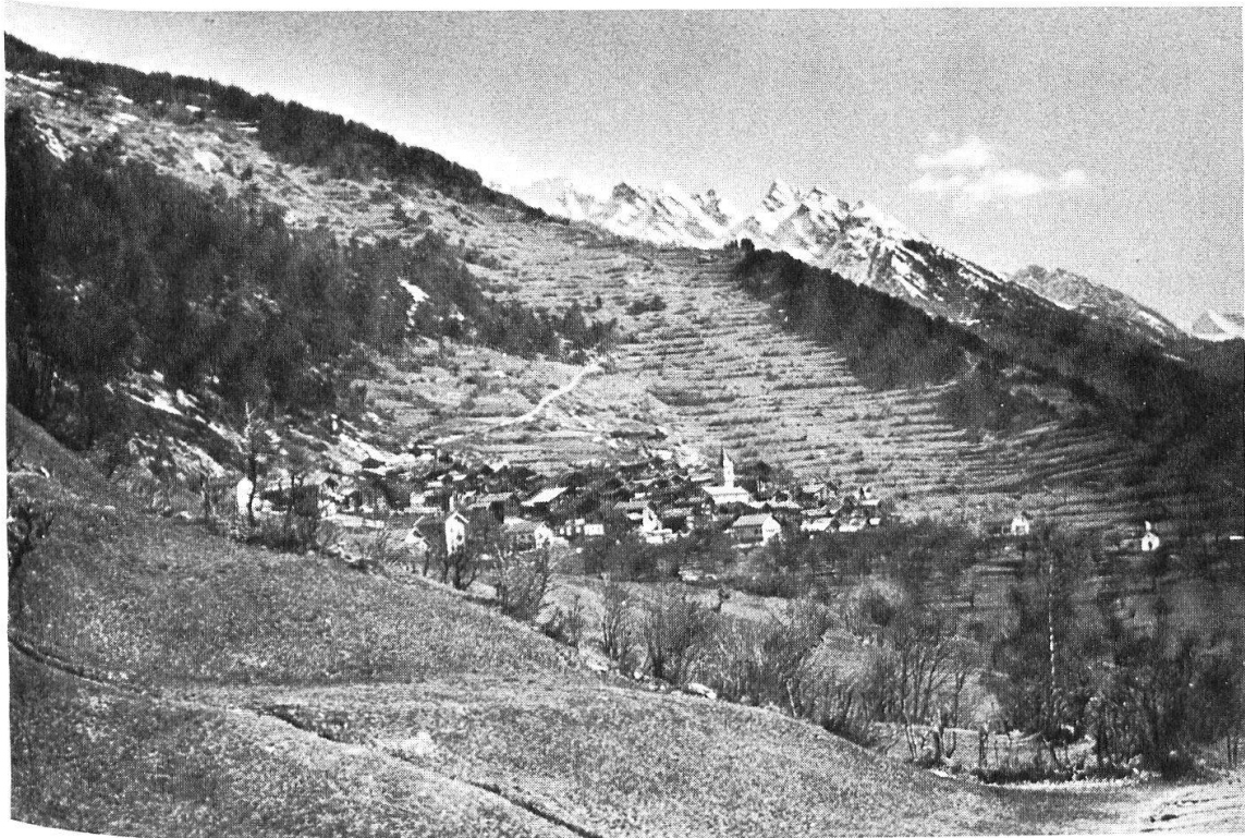
Abb. 22: Dorfterrasse von Erschmatt. Hinter dem Dorf steigt der von Hochrainen getreppte Hang der Unteren Zelg an.