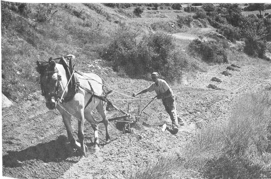
Abb. 26: Seit den vergangenen Vierzigerjahren hat der eiserne Wendepflug den Holzpflug abgelöst. Ein konsequentes Aufwärtspflügen ist nun möglich und wirkt der Abspülung entgegen.