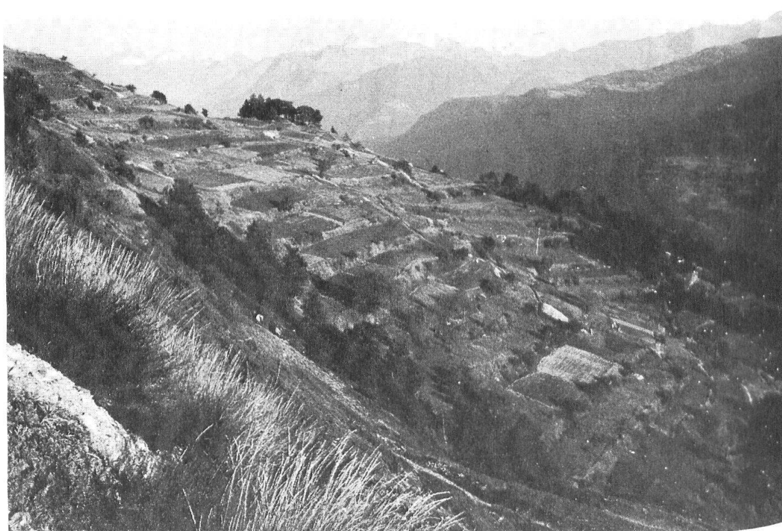
Abb. 25: Durch Hochraine terrassierter Hang der Oberen Zelg. Zwischen den angesäten Äckern sind sehr viele aufgelassene zu erkennen. Ab ca. 1970 wird der Anbau hier weitgehend verschwunden sein.