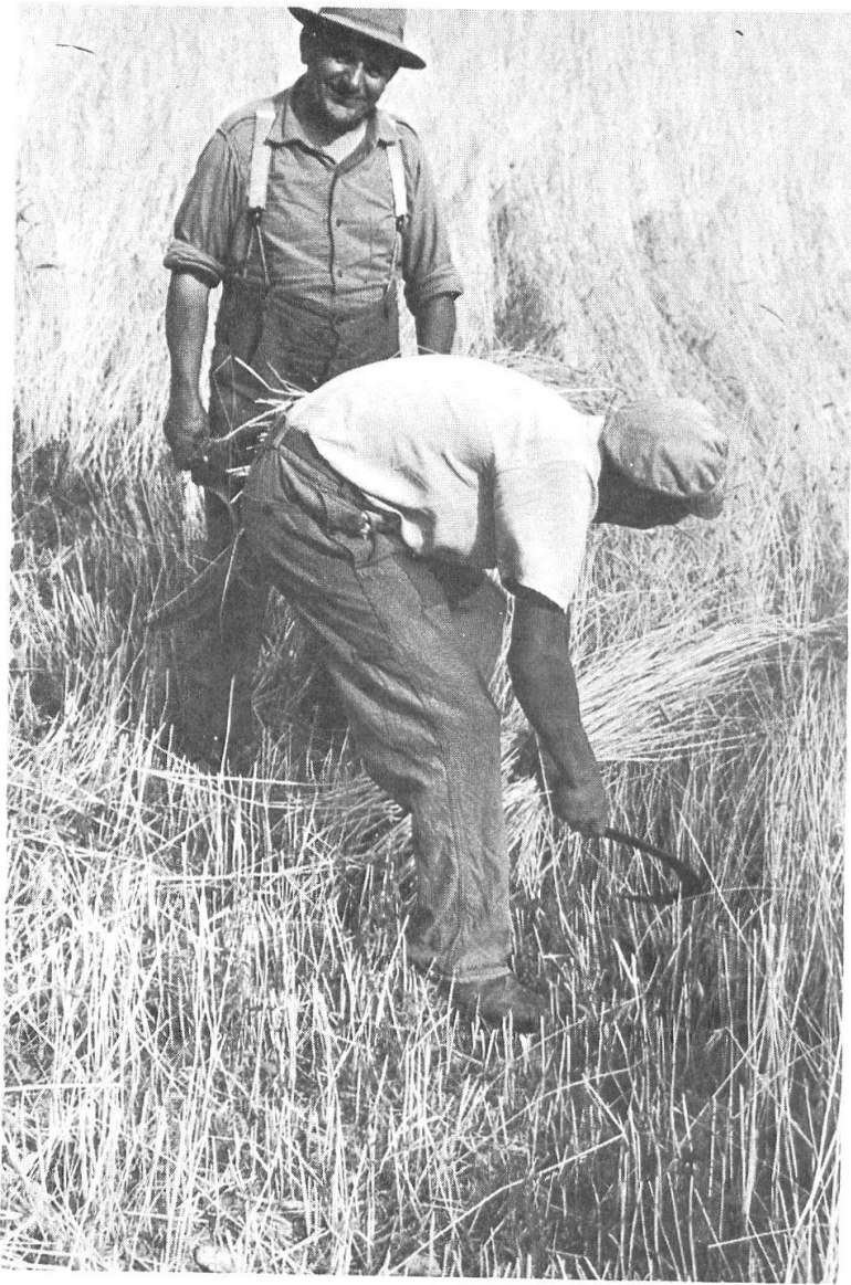
Abb. 32: Die weglose Flur und die Kleinheit der Parzellen bedingen noch heute den Getreideschnitt mit der Sichel.