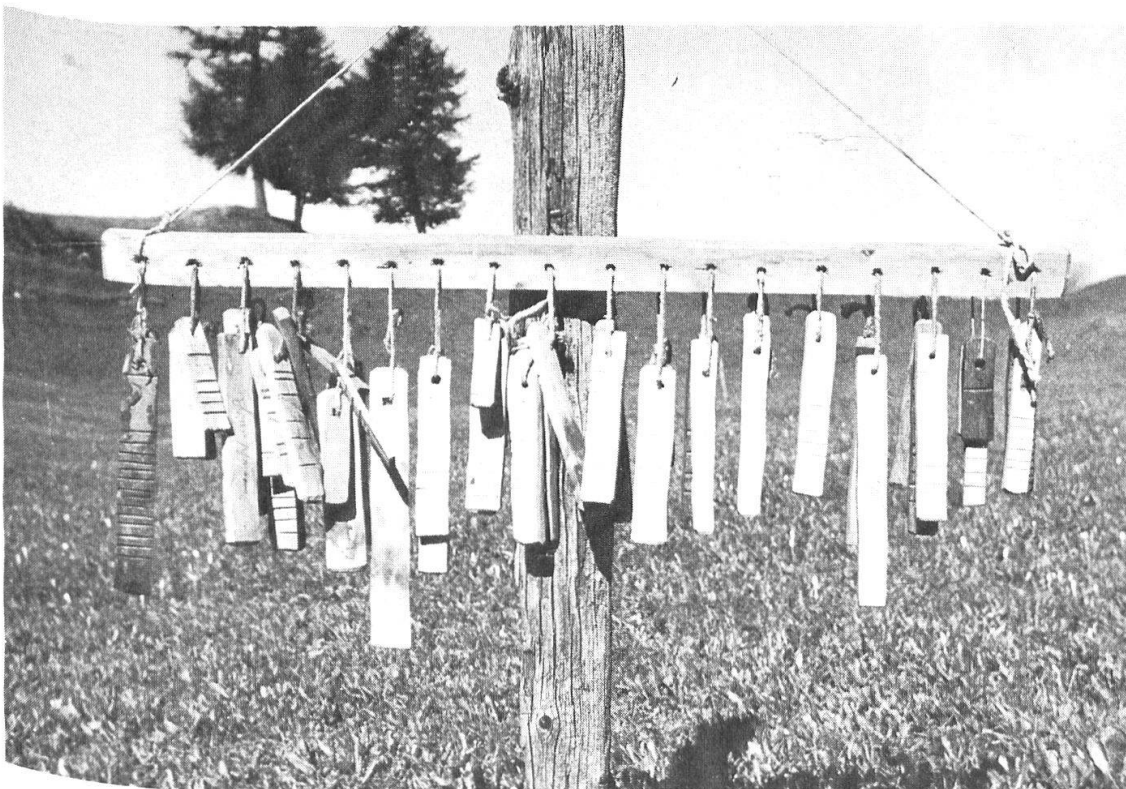
Abb. 31: Wassertesseln. Die 18 Löcher im Scheit entsprechen den 18 Kehren des Brentschenwassers. Jeder Kehr enthält 16 Guldi, die auf eine oder mehrere Familientesseln verteilt sind.