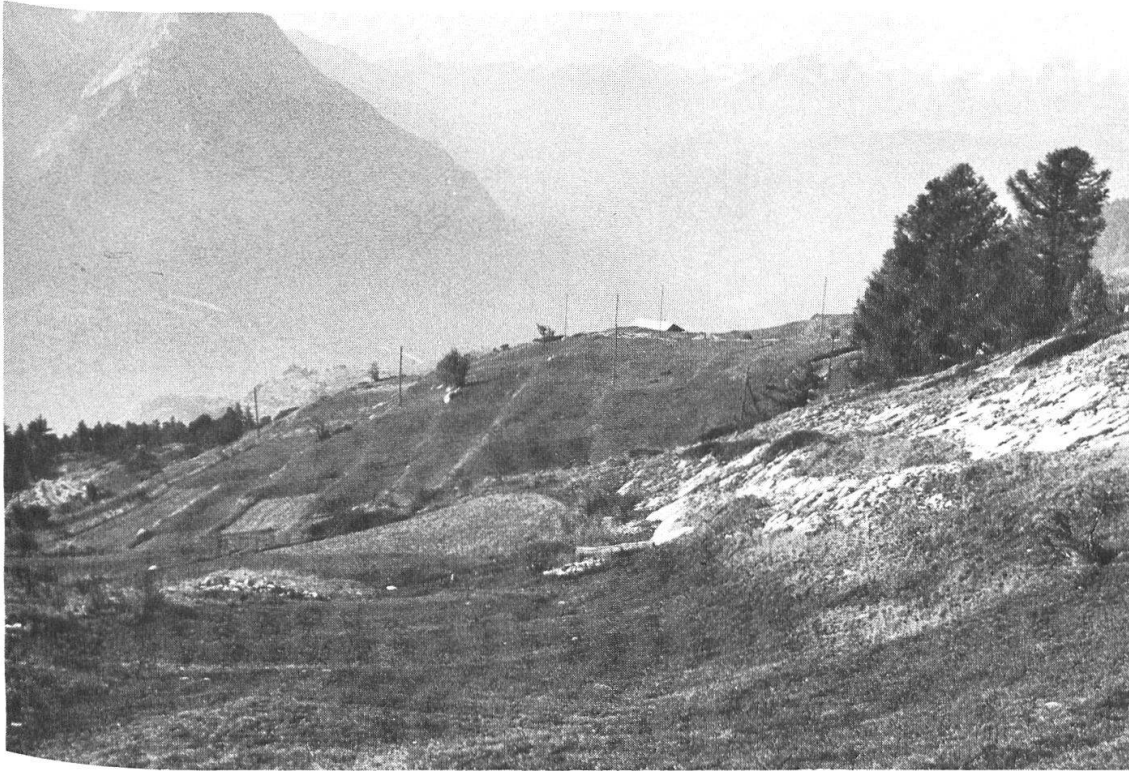
Abb. 30: Hochraine im heutigen Wiesland unter Brentschen.