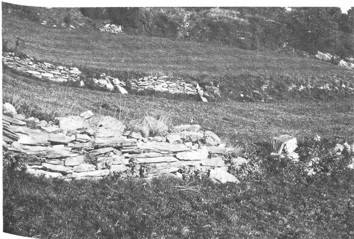
Abb. 27: Die häufig auftretenden Steinschichtungen an den Hochrainen haben nur selten Stützfunktion. Es handelt sich um platzsparend aufgeschichtete Lesesteine.