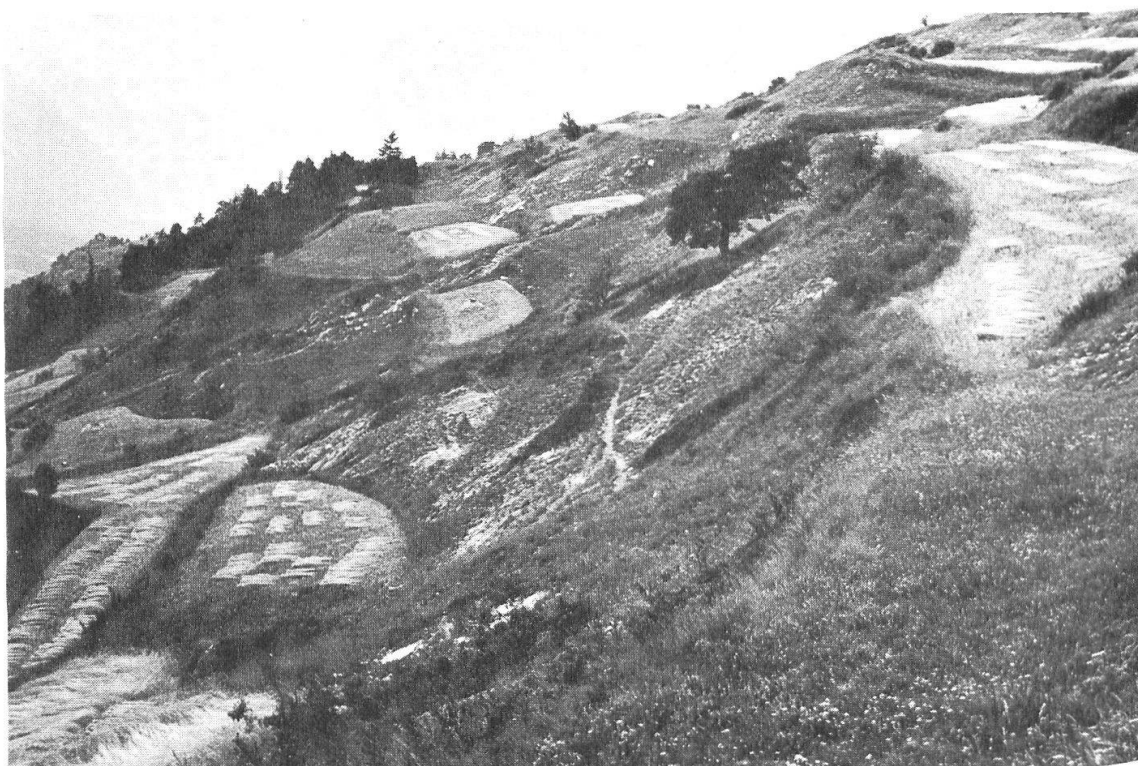
Abb. 24: Vielerorts liegen die Ackerstreifen eingebettet in die Felsensteppe des Steilhanges. Das Bild zeigt ein Stück der Oberen Zelg zur Zeit des Roggenschnittes.