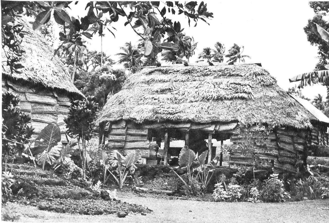
Abb. 1: Typisch samoanisches Haus: ein runder oder ovaler Pavillonbau auf einem künstlich errichteten Hügel mit hochziehbaren Seitenwänden und einem Dach aus Palmstroh (West-Samoa).