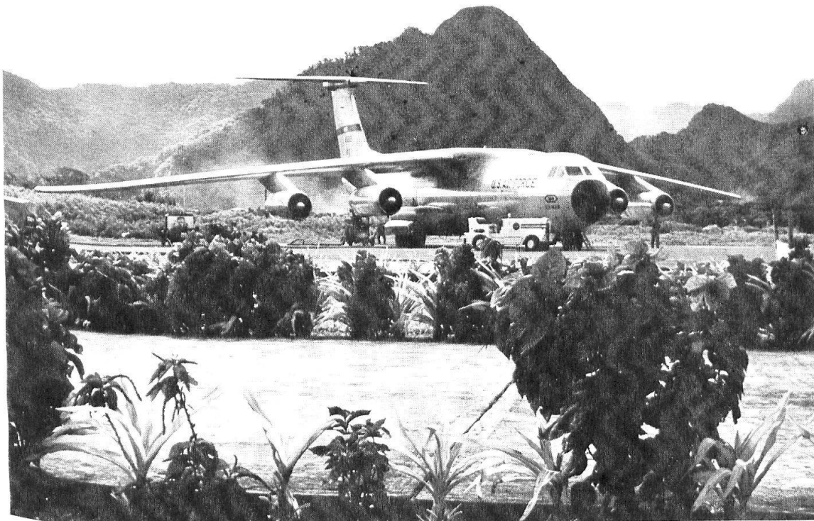
Abb. 6: Der internationale Flugplatz von Pago Pago dient nicht nur dem zivilen Luftverkehr; auch riesige Transportflugzeuge der US Air Force landen hier zur Versorgung des amerikanischen Stützpunktes im Südpazifik.