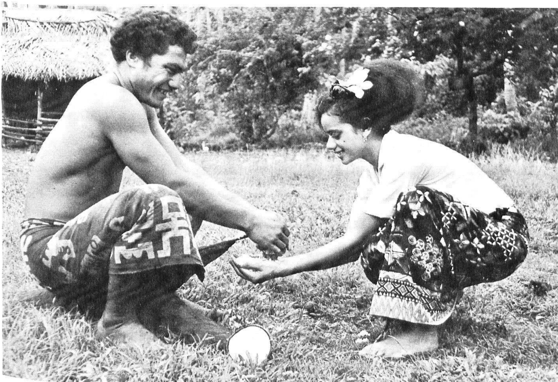
Abb. 2: Verarbeitung von Kokosnüssen: das weiße Fruchtfleisch wird mit Hilfe eines Raffeisens aus der Hartschale herausgekratzt (West Samoa).