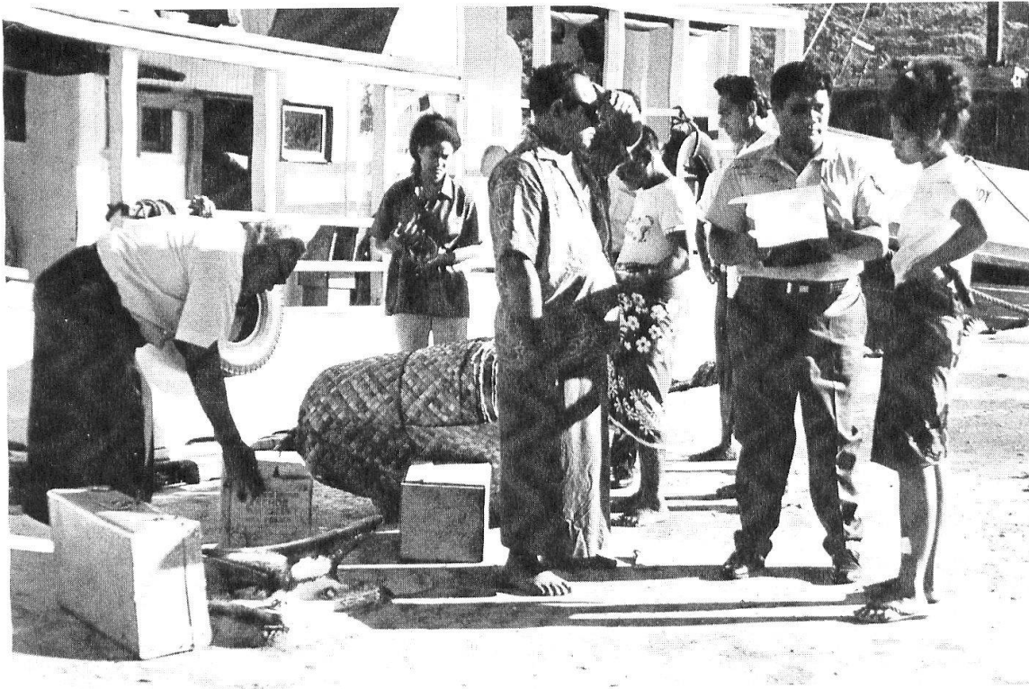
Abb. 5: Im Hafen von Pago Pago kontrollieren ostsamoanische Zöllner die eingeführten Waren. Importgüter aus den USA sind ebenfalls gebührenpflichtig.