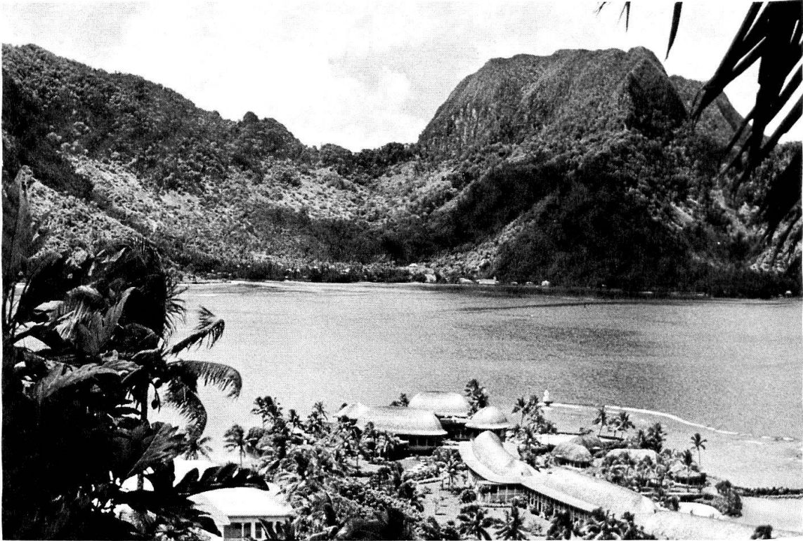
Abb. 3: In einer tiefen Kraterbucht, geschützt durch steil aufragende Bergflanken, liegt der Naturhafen von Pago Pago auf Ost Samoa. Im Vordergrund der Pavillonbau des neuen Pago Pago Intercontinental Hotels, im Hintergrund der Mount Rainmaker.