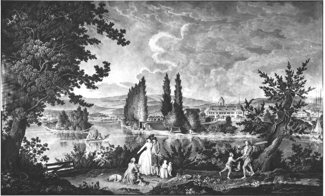
Abbildung 3 Gottstatt. Aquarell von Heinrich Füssli, 1781 (Bernisches Historisches Museum, Inv.-Nr. 2355).