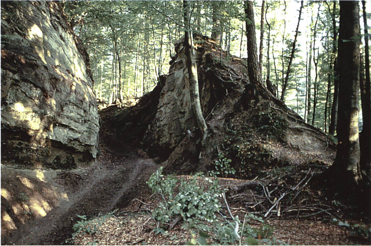
Abb. 6: Die Leuenhole bei Burgdorf, Teilstück der spätmittelalterlichen Hauptverbindung von Bern nach Luzern. Sie wurde als landschaftliches Markenzeichen und Teil der Emmentaler Geschichte u.a. auch in Gotthelfverfilmungen einbezogen.

Kulturlandschaft erleben, er wird auch einen Teil seiner eigenen Geschichte begehen, nämlich den Weg, den die Emmentaler Bauern 1653 bei ihrem Aufstand gegen die Berner Obrigkeit benutzten. Diese – die «eigene» – Geschichte und Kultur ist als Markenzeichen in jeder Hinsicht unverwechselbar. Sie ist ebenso ortsgebunden wie die Geschichte der alten Bern–Luzern–Strasse, mit ihren unzähligen Erzählungen und Legenden.