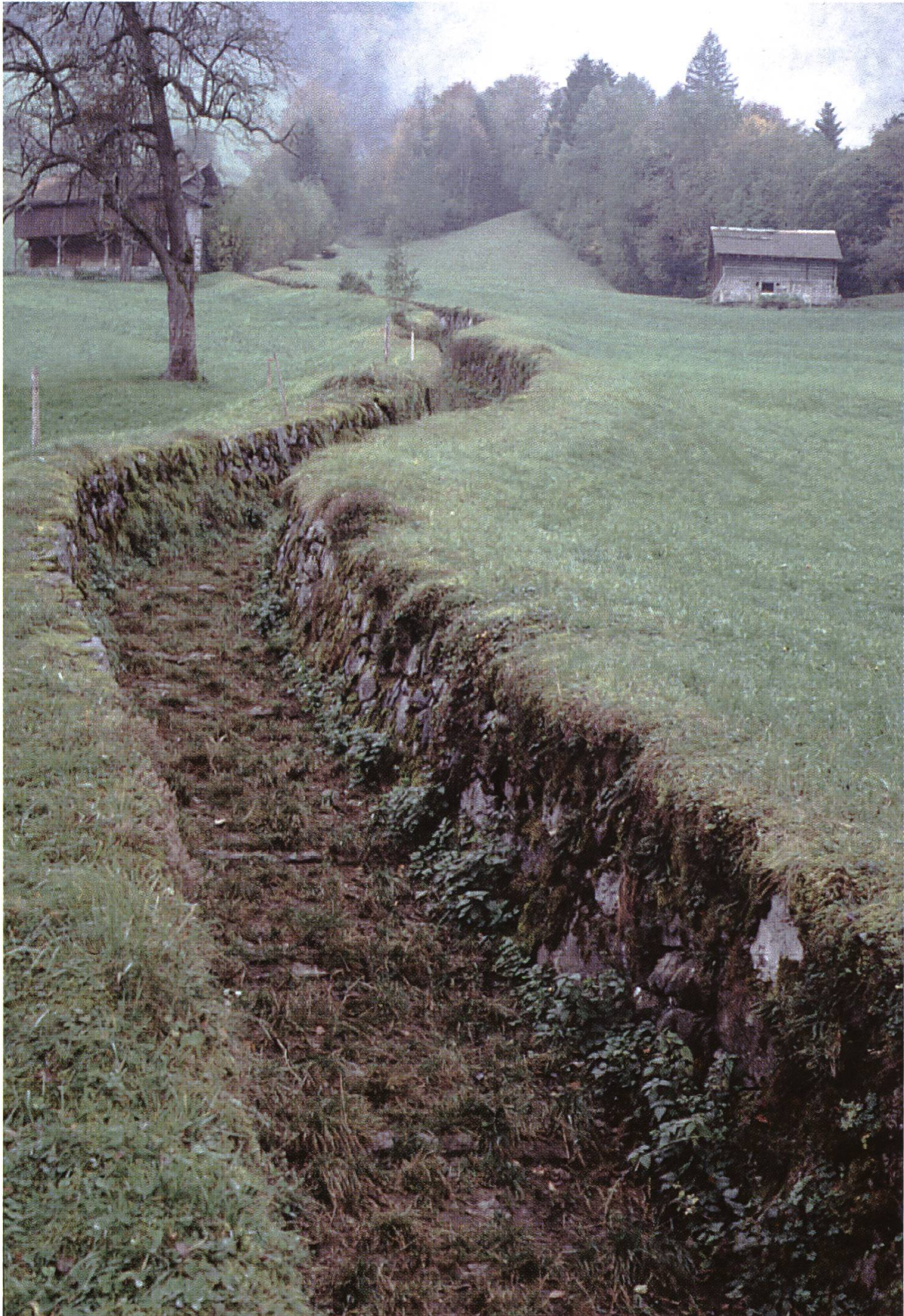
Abb. 1.: Alte Alpgasse bei Attinghausen – eine eindruckliche Schnittstelle zwischen Landwirtschaft und Landschaftsschutz.