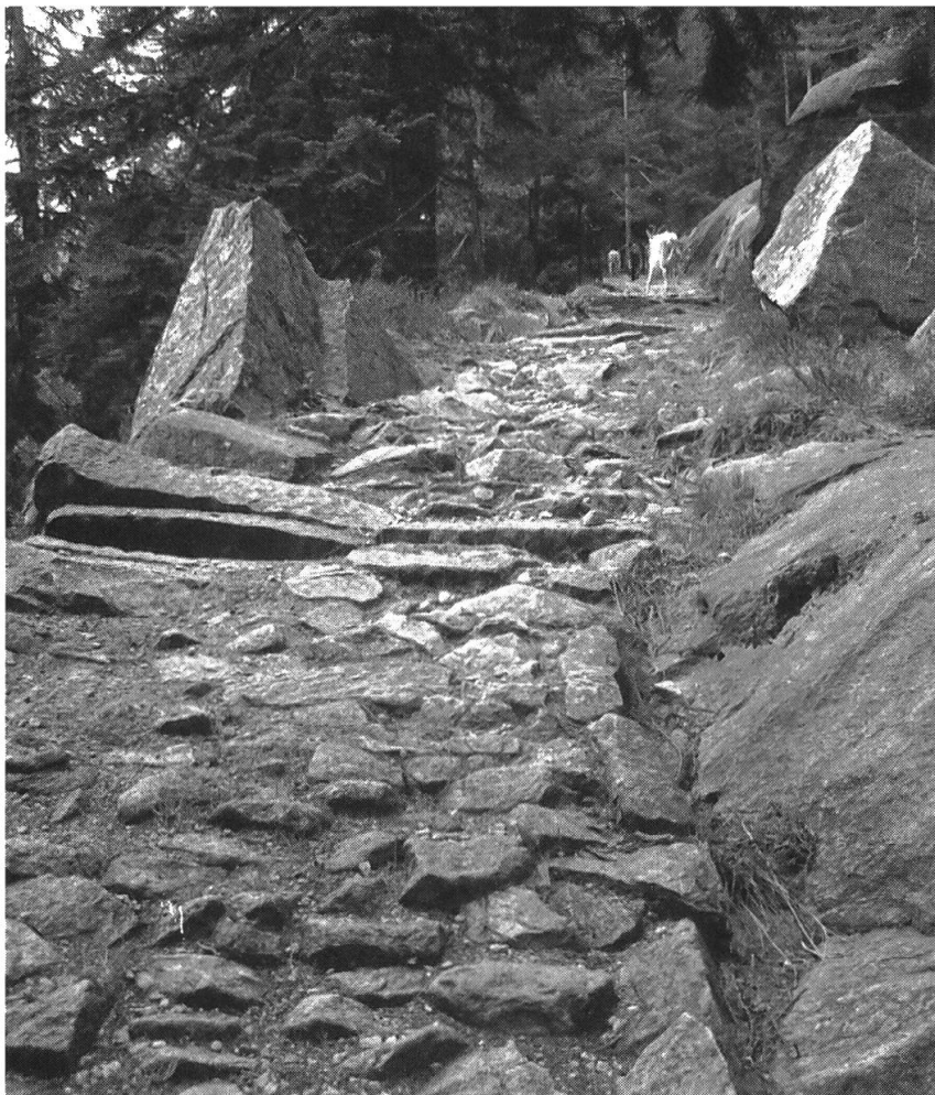
Abb. 2: Gornerenweg bei Gurtnellen: Interessenabwägung zugunsten eines wunderschön gepflasterten Alpweges.

Was noch fehlt, ist einerseits eine Verknüpfung der Absichtserklärungen mit den Grundlagen des Natur- und Landschaftsschutzes und die Notwendigkeit zur Abkehr vom sektoriellen Denken nach traditionellem Muster. Bezogen auf die drei oben erwähnten Sachbereiche muss anstelle der bisherigen Tourismus-, Landwirtschafts- und Forstpolitik eine umfassende Siedlungs- und Landschaftspolitik treten, die den Absichtserklärungen in dem Sinne Rechnung trägt, dass sie die Inventare des Natur- und Landschaftsschutzes als prioritäre Grundlage einbezieht. Der Gedanke, das Bestehende in den Mittelpunkt aller raumrelevanten Tätigkeiten zu stellen, ist im übrigen nicht neu, wurde er doch vom Bundesrat bereits 1987 in seinem Raumplanungsbericht aufgenommen: «So sind beispielsweise Verkehrswege, Leitungssysteme, flächige Verbauungen, Terrassierungen usw. so zu planen, dass die die Landschaft prägenden Strukturen und natürlichen Reliefs erhalten bleiben und freie, naturnahe Landschaften vor weiteren Zerschneidungen bewahrt werden» (SCHWEIZERISCHER BUNDESRAT, 1987: Leitsatz 11).