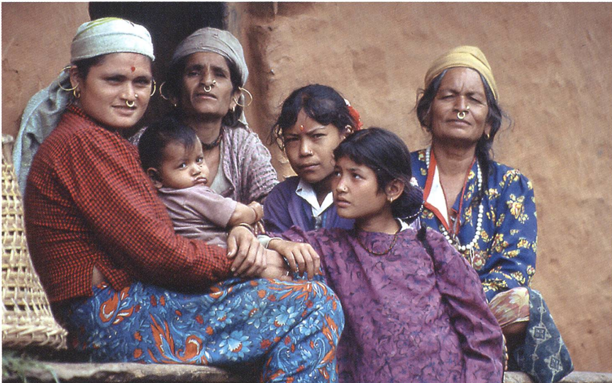
Foto 1: Frauen und Kinder in einem Dorf in Far West Nepal

Die Sozialbeziehungen einer Gemeinschaft definierte er als «natürlich», basierend auf Verwandtschaft oder räumlicher Nähe (Dorfgemeinschaft). In Kontrast zu dieser vorindustriellen, auf Vertrauen basierenden Sozialbeziehung setzte Tönnies die rationale, durch Nützlichkeitsabwägungen bestimmte moderne (kapitalistische) Industriegesellschaft. Ähnlich wie Max Weber, beschrieb Tönnies den sozialen Wandel in der Moderne als einen Individualisierungs- und Rationalisierungsprozess, unter dessen Bedingungen es keine «echten» Gemeinschaften mehr gäbe.