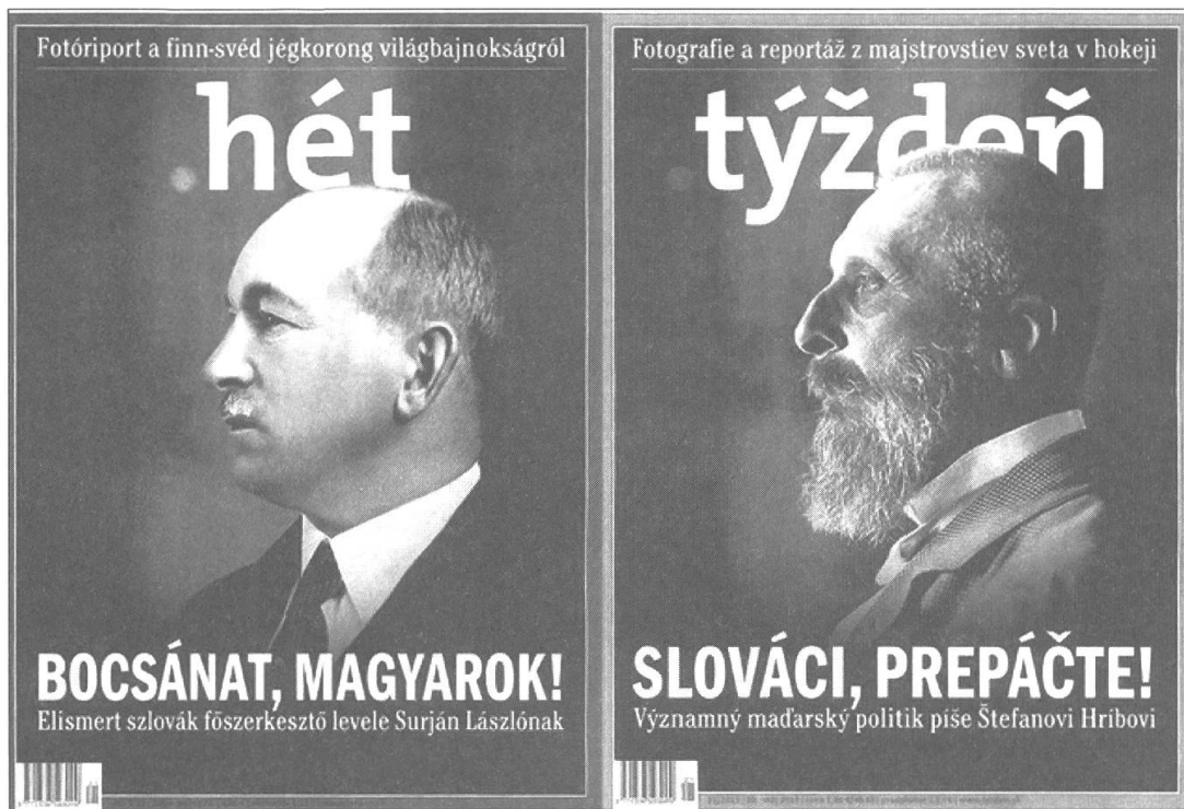
Abbildung 2: Ungarische Rückseite (links) und slowakische Frontseite (rechts) der slowakischen Zeitschrift .tyzden mit der gegenseitigen Entschuldigung (tyzden 2013).

.tyzden, gab im Mai des Jahres eine Ausgabe mit einer slowakischen Frontseite und einer ungarischen Rückseite heraus (siehe Abbildung 2).