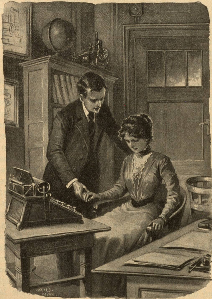
E buca mo per cuort temps...

„Soretta“, di el riend, „per gliez havein nus finfatg buca giu temps. Sche ti saves-