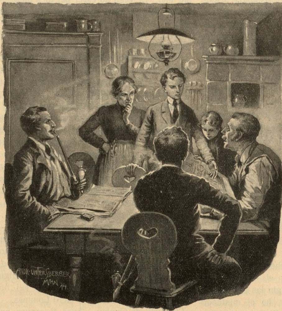
Quei che jeu digel quella gada va era tier a vus.

cun mèsch sin via electro-chemica: ... Co, gliez ei miu misteri. Ils exemplars che jeu hai fabricau tochen uss ein denton secomprovai, — pli bein ch' ils megliers dil sistem vegl.“ „E has ti plidau cul muliner?“ „Gie el ei obligaus sin la porschida ch' jeu hai detg a vus, entochen en sis jamnas. Sin lu stoi jeu dir segir ad el!“ „Tgei pupi ei quei?“ „Bein schon il plan de tia fabrica?“ — „Ti