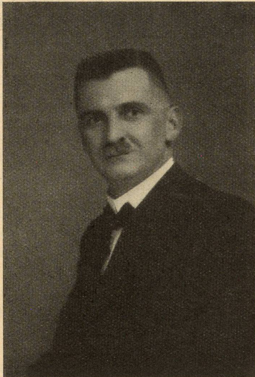
Mistral Gieri Cajacob Dapi 7 onns mistral della Cadi

cussegl pign. Ei quei atgnamein perdert? Che tuts 5 stoppien ir en inagada, fuss schon buca da recomandar sco regla, schegie ch'ins ha dagl'emprem de schaner, pervia dil novum della regenza, aunc observau negins tiaratriembels el stadi. Igl ei iu tut ruasseivlamein sco adina vinavon. En biars cantuns restan ils cussegliers guvernativs ton sco lur entira veta en uffeci, ed era quei va, ei dependa gie dapertut pli bia dals umens che dalla leschas. (Forsa anfla in dils signurs per bien, tier las proximas leecziuns de passar anavos, lu fuss quella dif-