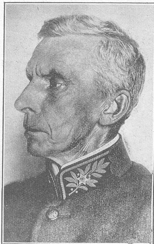
† Teofil Sprecher de Bernegg chef dil generalstab

staus en detschartamein per la fortificaziun dil Gotthard e s. Murezi, schebi ch'el ha stuiu udir persuerter beffas e gomias. 1905 eis el vegnius numnaus schef dil generalstab. Il pli vess ha el fatg de stuer seretrer naven da ses praus per ir a Berna e surpender siu ault e fetg responsabel uffeci. El ha suondau il clom ord sincera carezia per la patria. Vesend Sprecher fetg bein ordavon ch'ei vegni en cuort a dar uiarra eis el semess cun tutt'energia vid la gronda reorganisaziun dil