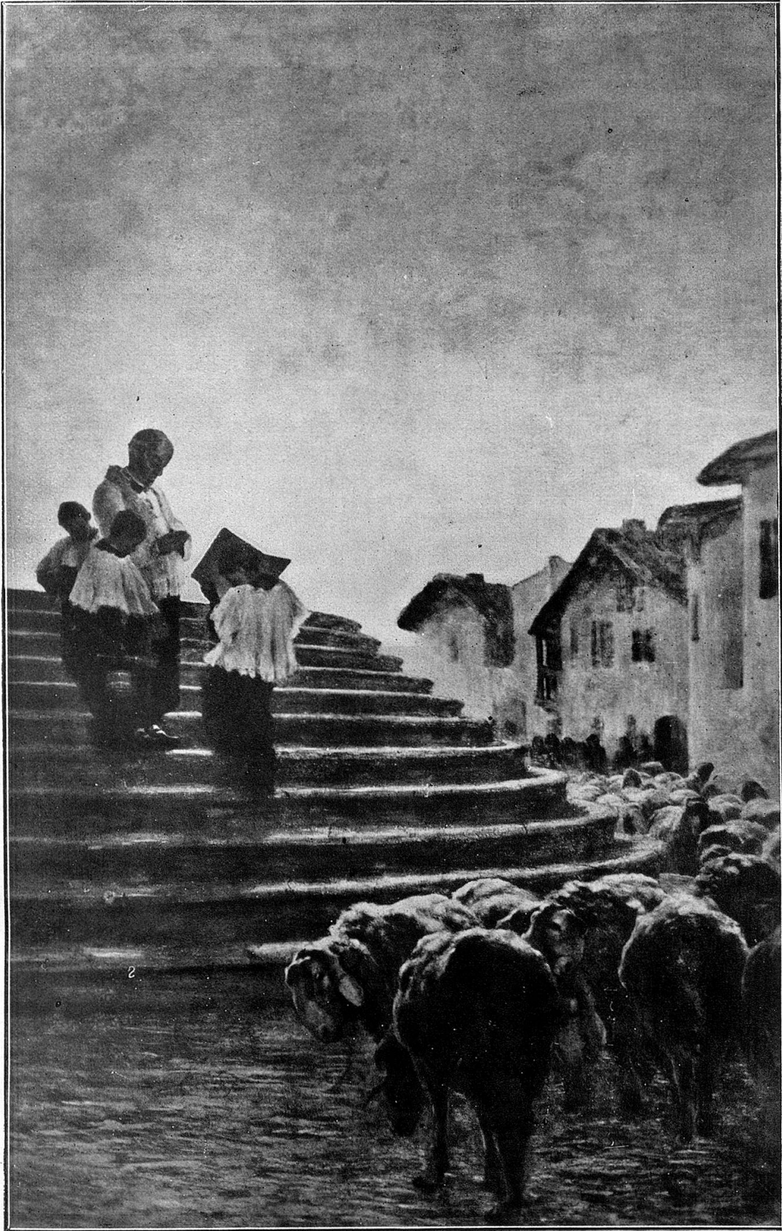
La benedicziun dellas nuorsas