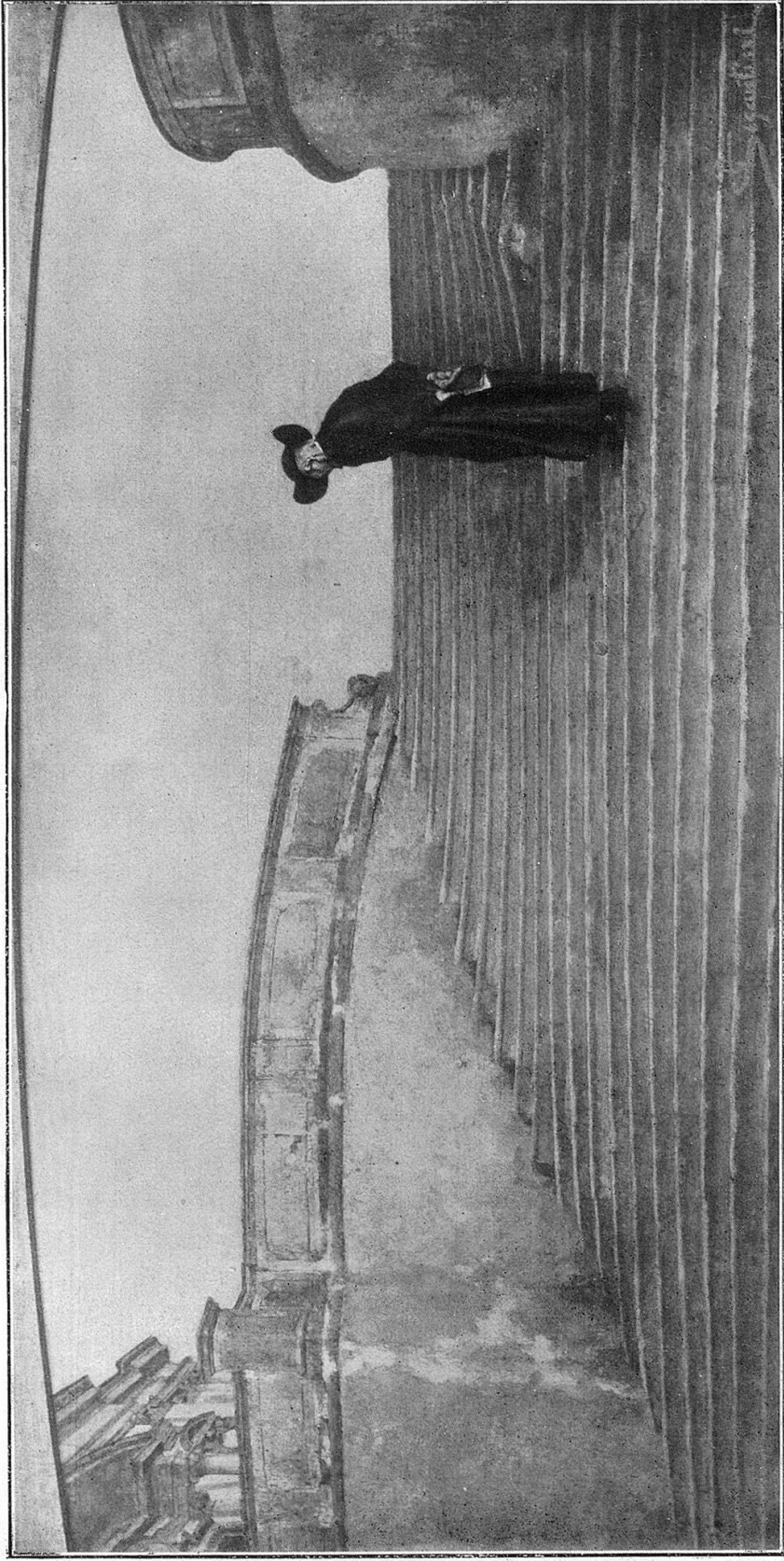
A Messa marvegghia