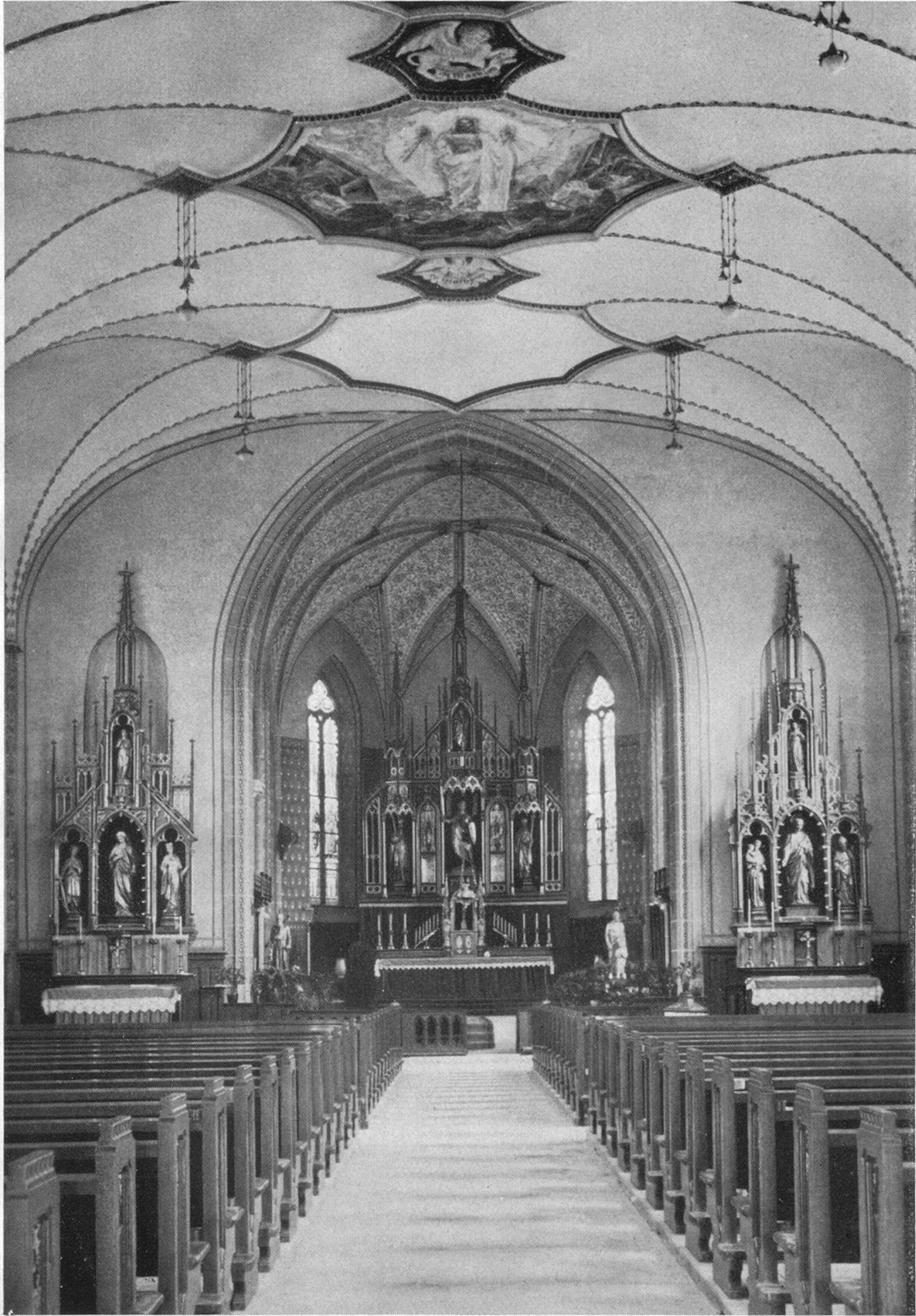
Interior della basilica nova de Gams