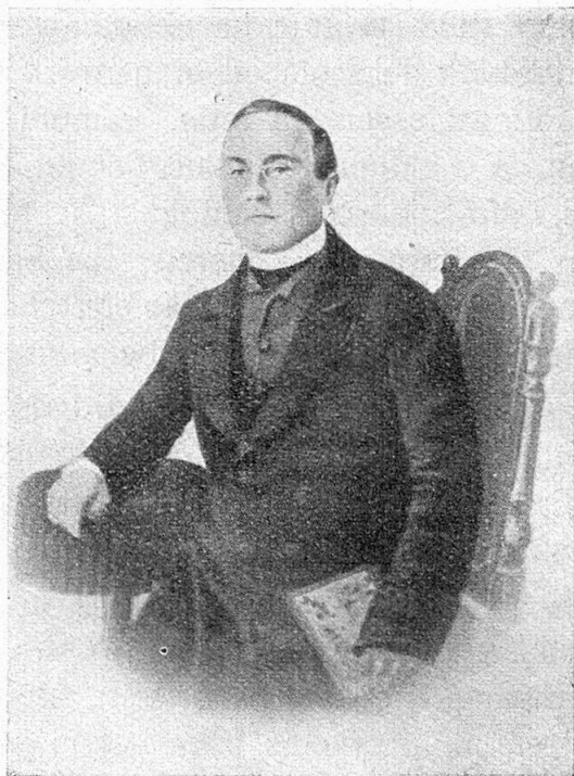
Sur Durgiai, giuven academicher a Minca

Denton era la pervenda de Surcasti en Lumnezia vegnida vacanta, ed ins ha tulenu el de sorprendere quella, entochen ch'el ha cedi, ch'ei de contribuir allas supplicas de sia mumma, che leva che siu Sur fegl praticeschi de plevon, essend spiritual. — Mo era a Surcasti han ins schau ad el negin ruas. Duront quei temps (3 onns eis el staus a Surcasti), ha il cussegl de educaziun buca tschessau de tulenu el cun lavurs e supplicas per bien e prò della scola populara e cantonale. El ha translatau cheu, sco capavel literat romontsch, entschins cudischs de scola per commissiun dil cussegl d'educaziun ed ha ultra de quei continuau cun ses studis historics e filologics.