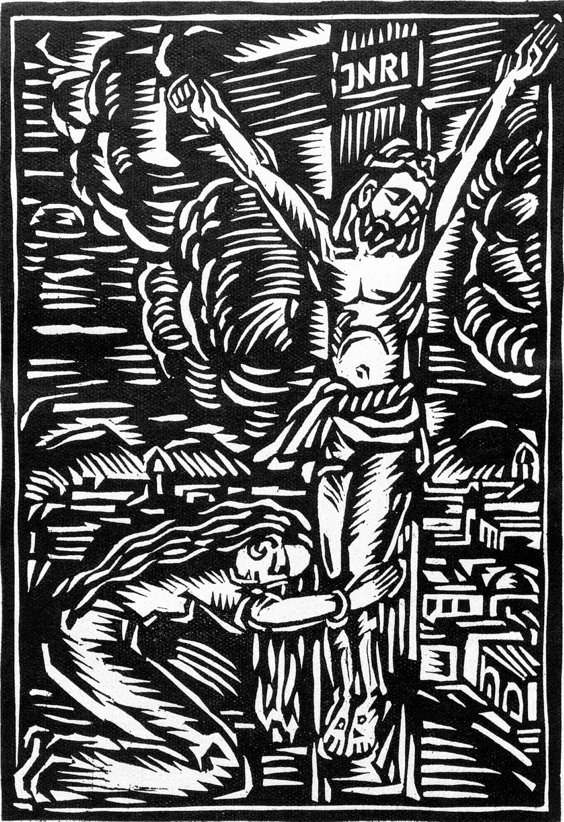
S. M. Madleina sut la crusch