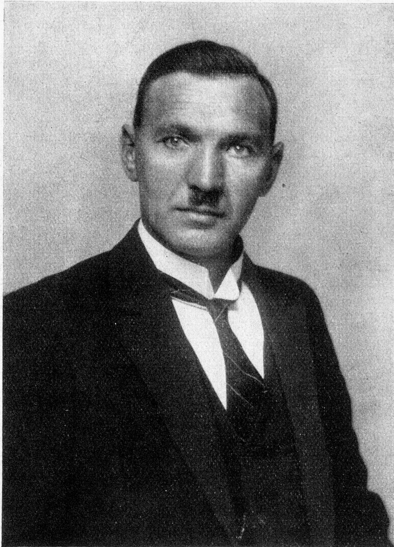
† Sep Modest Nay p. m.

instructers. La roschada d'emprendists ord tuttas vischnauncas della Cadi che ha accumpignau la bara de lur premurau e renconuschiu um de scola al davos ruaus a Danis, las flurs verdas che quels han tschentau sin sia fossa frestga ein stai in modest engraziament pil grond quitaus che Nay ha giu per la giuventetgna.