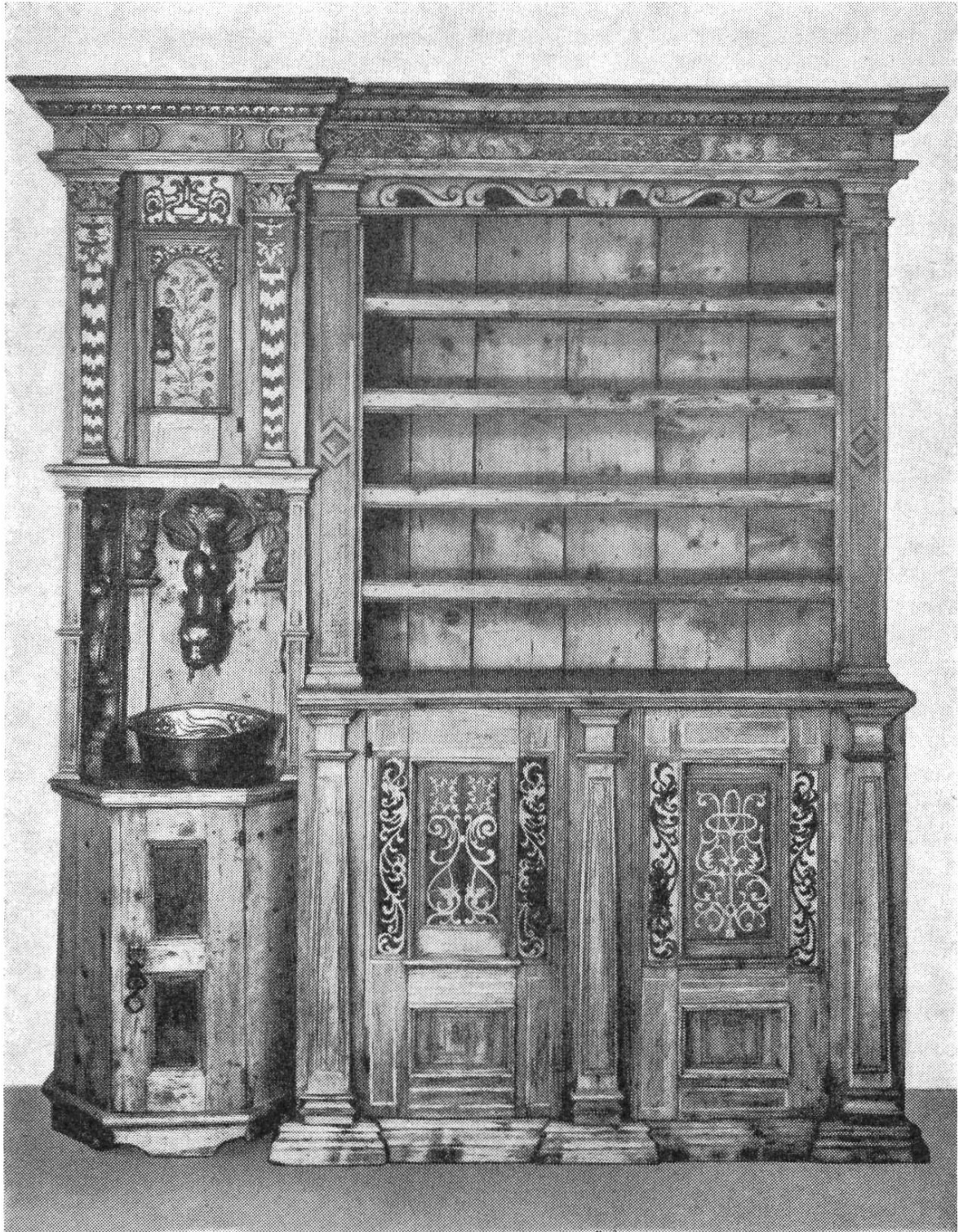
Büffet aus Bergün nach der Reinigung durch Schreinermeister Jakob Bühler, Chur.