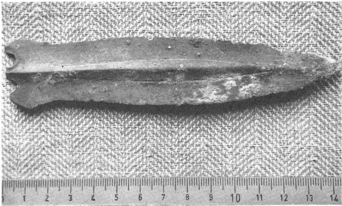
Bronzedolch von Truns/Caltgera. Aufnahme Bertoggg

Im Spätherbst wurde im SW des Friedhofes von St. Martin in Ilanz ein Wasserleitungsgraben aufgeworfen. Dabei kamen verschiedene Bodestücke laveartiger Großgefäße aus Speckstein, ein Hirschhornzapfen und zwei Spinnwirtel zum Vorschein.